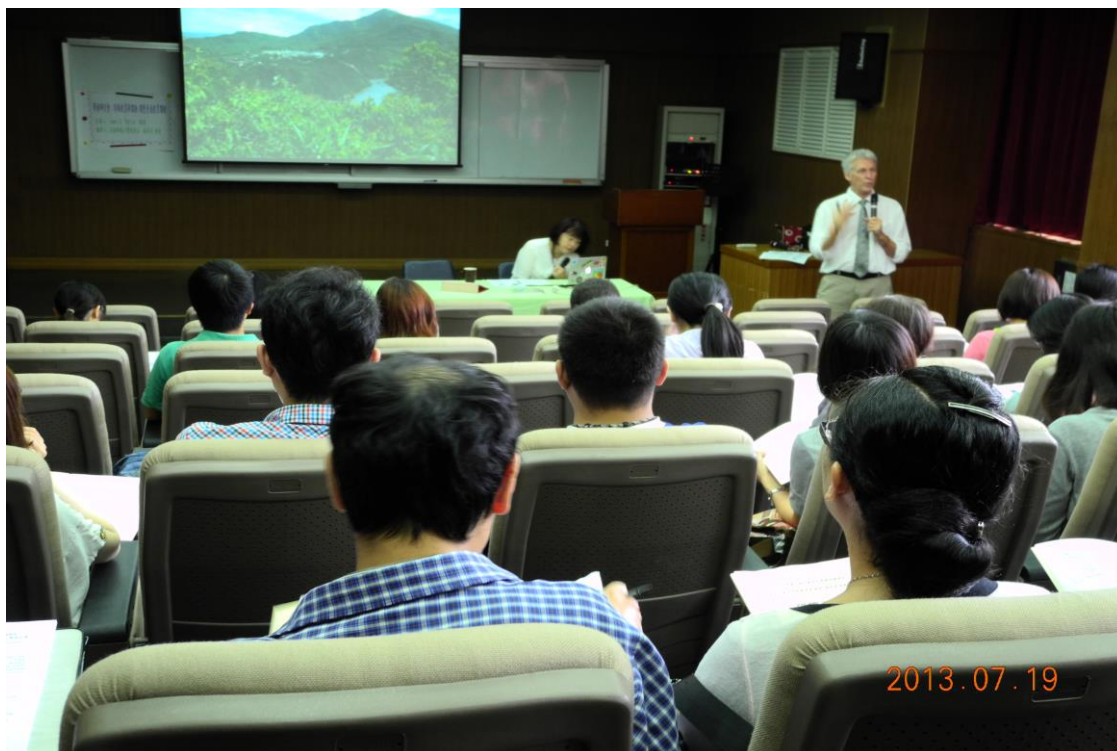
主 題：學術研討會 主講者：James R. Patton 教授 日 期：102 年 7 月 19 日