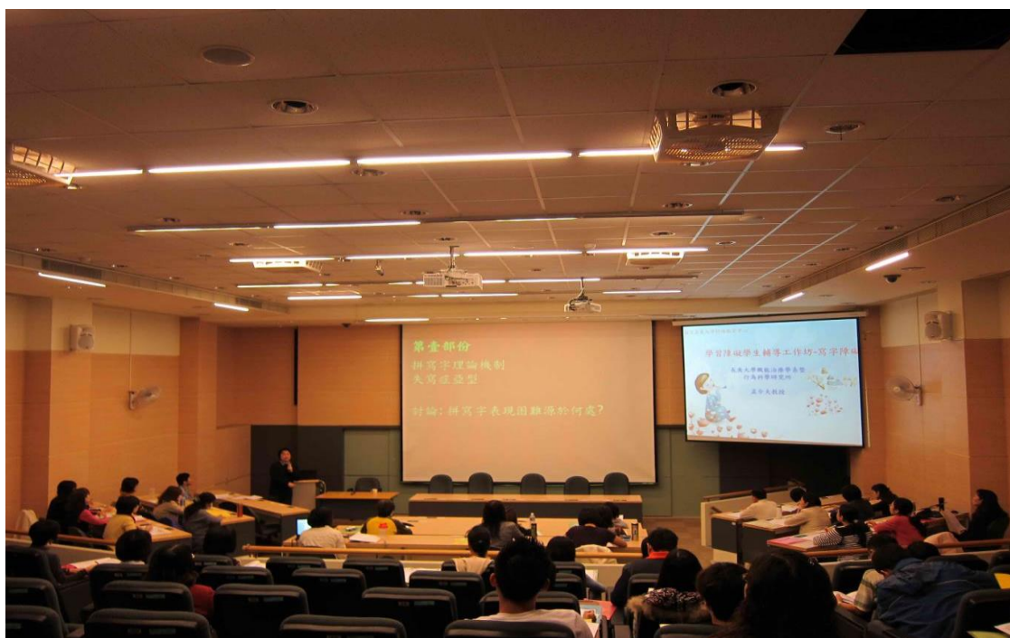
主 題：學習障礙學生輔導工作坊-寫字障礙 主講者：孟令夫教授 日 期：102年4月13日