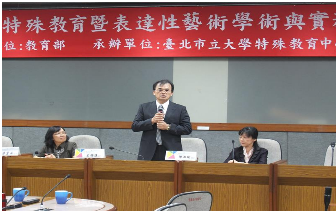
主 題：2013 特殊教育暨表達性藝術學術與實務論文研討會 日 期：102 年 10 月 26 日