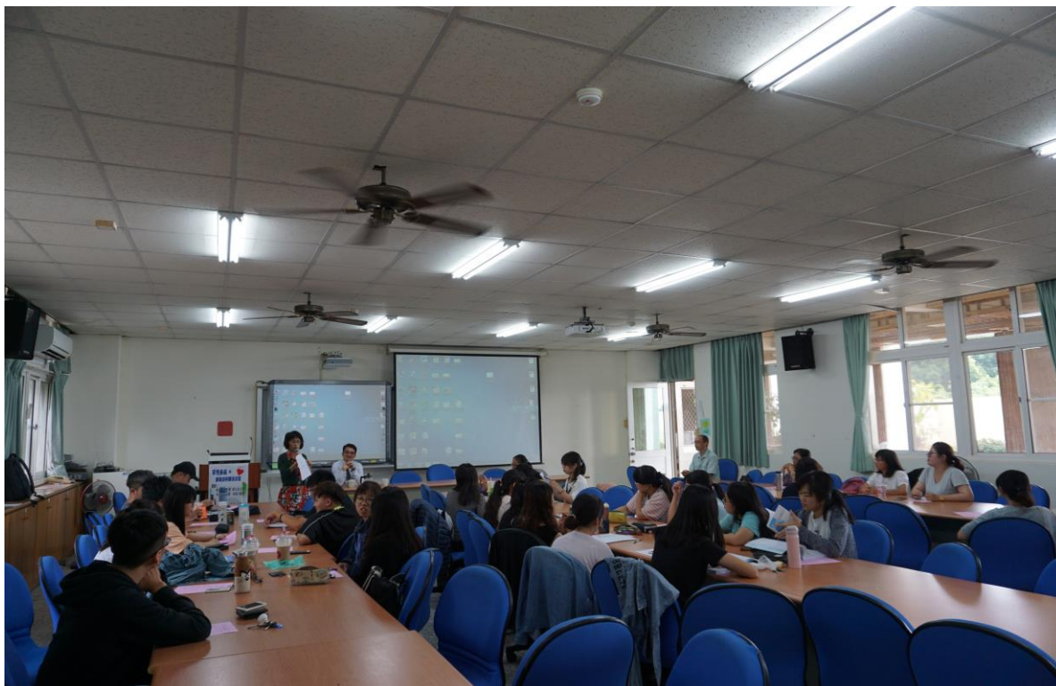
主 題：罕見疾病與藥物誤用關係 主講者：李江文教授、吳東川教授 日 期：107年10月17日