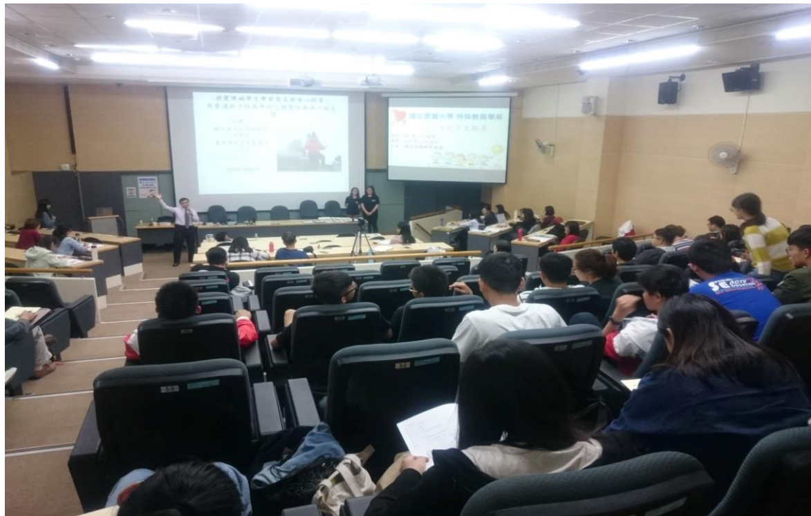
主 題：視覺障礙學生輔導研習 主講者：林慶仁教授 日 期：107年11月28日