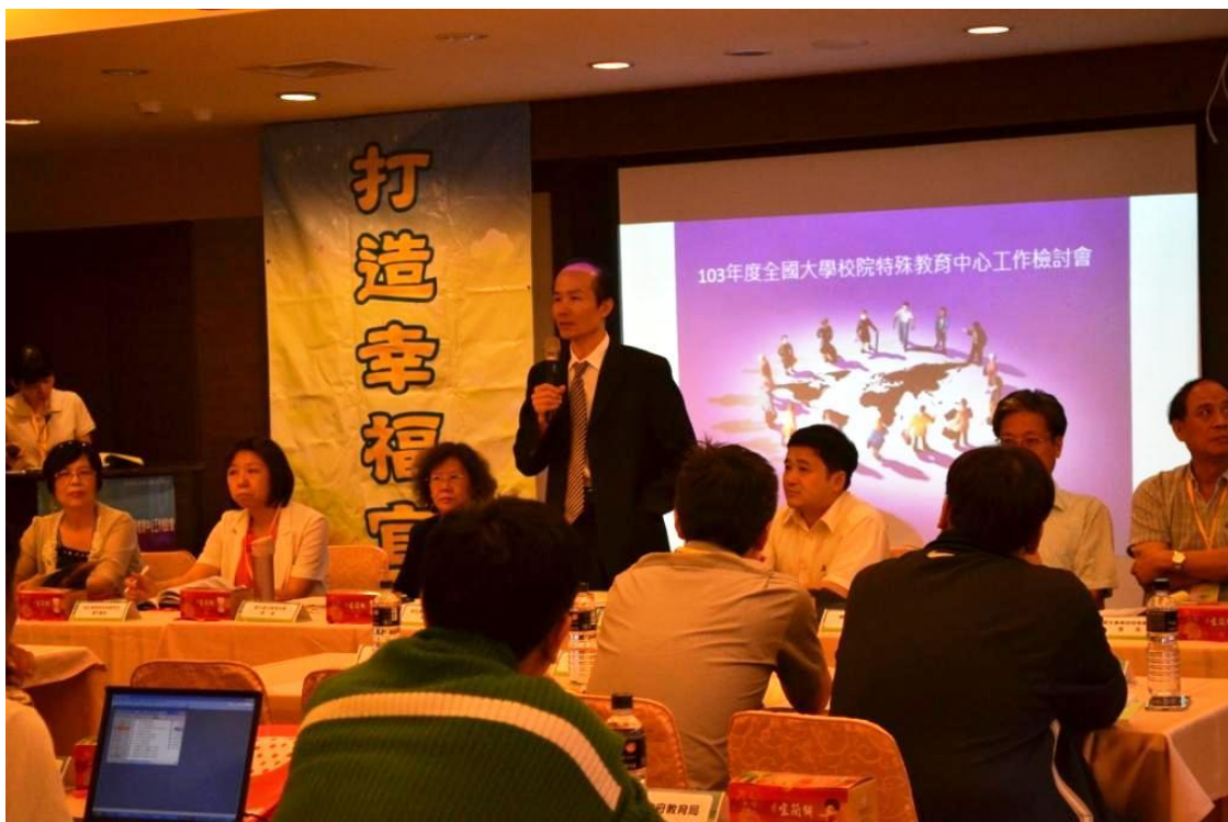
主 題：103 年度全國大學校院特殊教育中心工作檢討會 主講者：劉仲成司長 日 期：103 年 6 月 12 日～6 月 13 日