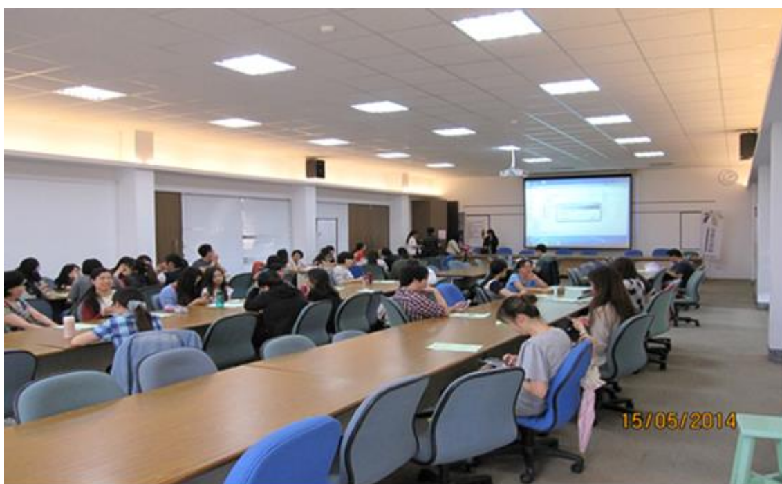
主 題：特殊教育之性別平等教育教材、教法研習 主講者：黎源悅老師 日 期：103 年 5 月 15 日