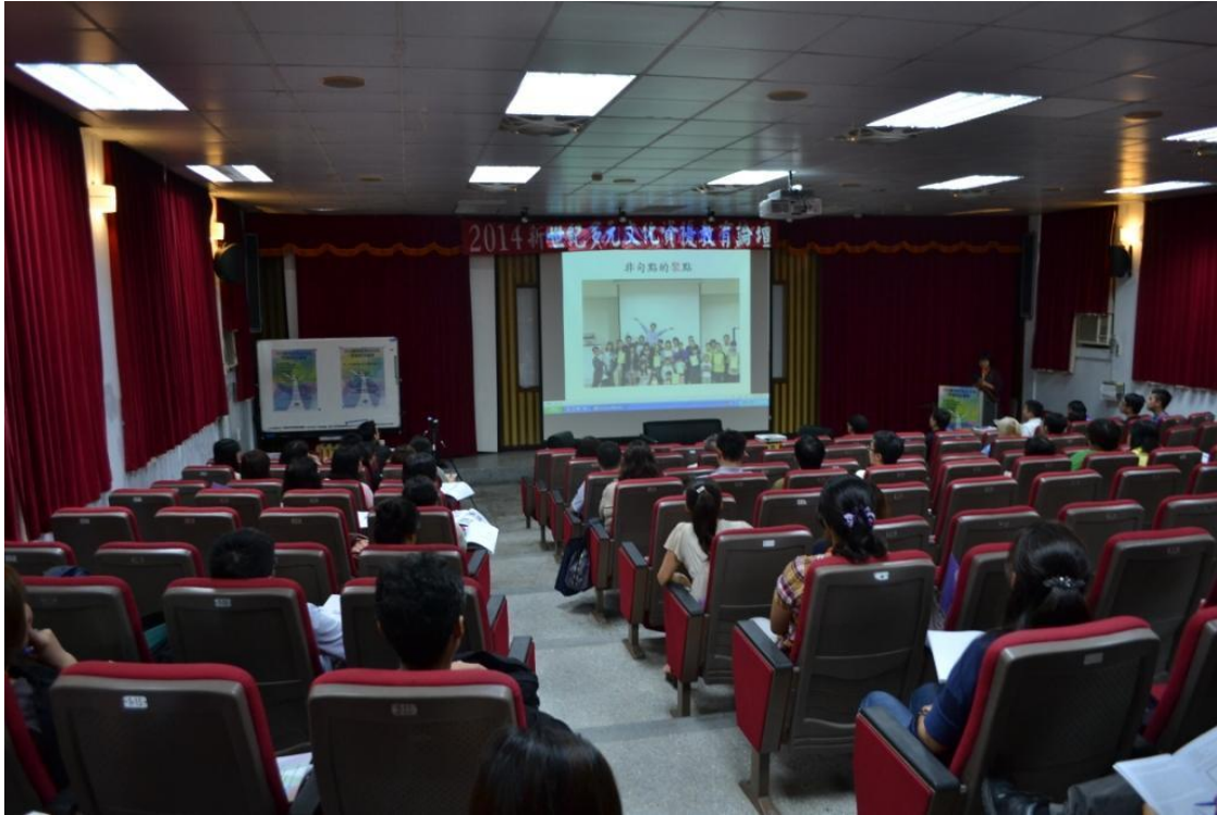
主 題：新世紀多元文化資優教育論壇 主講者：陳昭儀教授 日 期：103 年 5 月 31 日～6 月 1 日