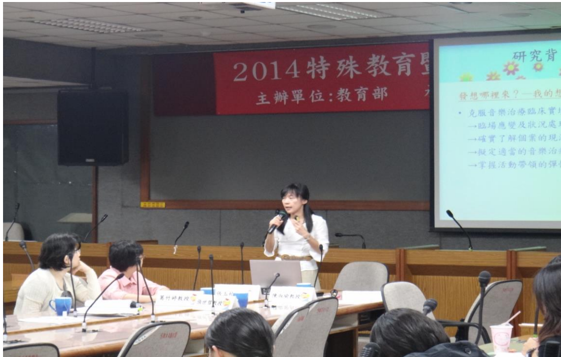
主 題：2014 特殊教育暨表達性藝術學術與實務論文研討會 日 期：103 年 10 月 25 日