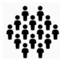
Đối tượng cách ly tập trung