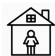
Đối tượng cách ly tại nhà

Lao động nước ngoài do ảnh hưởng của dịch bệnh, người bị cách ly, kiểm dịch có thể nộp đơn lên Bộ Y tế - Phúc lợi để được xin nhận bồi thường phòng chống dịch bệnh mỗi ngày 1.000 Đài tệ (Phí bồi thường chống dịch bệnh có thể nộp đơn xin nhận bồi thường trong vòng 2 năm kể từ ngày kết thúc cách ly hoặc kiểm dịch)