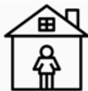
Đối tượng kiểm dịch tại nhà