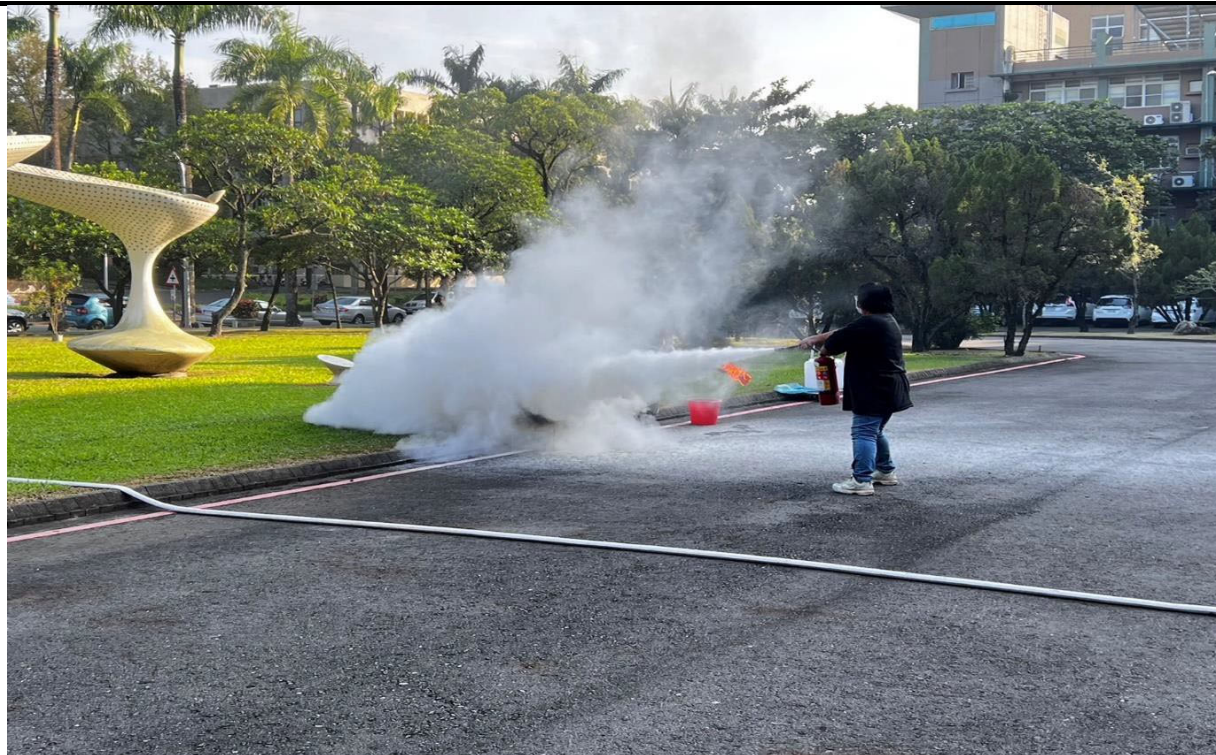
說明：消防實務演練-成員實際操作使用滅火器