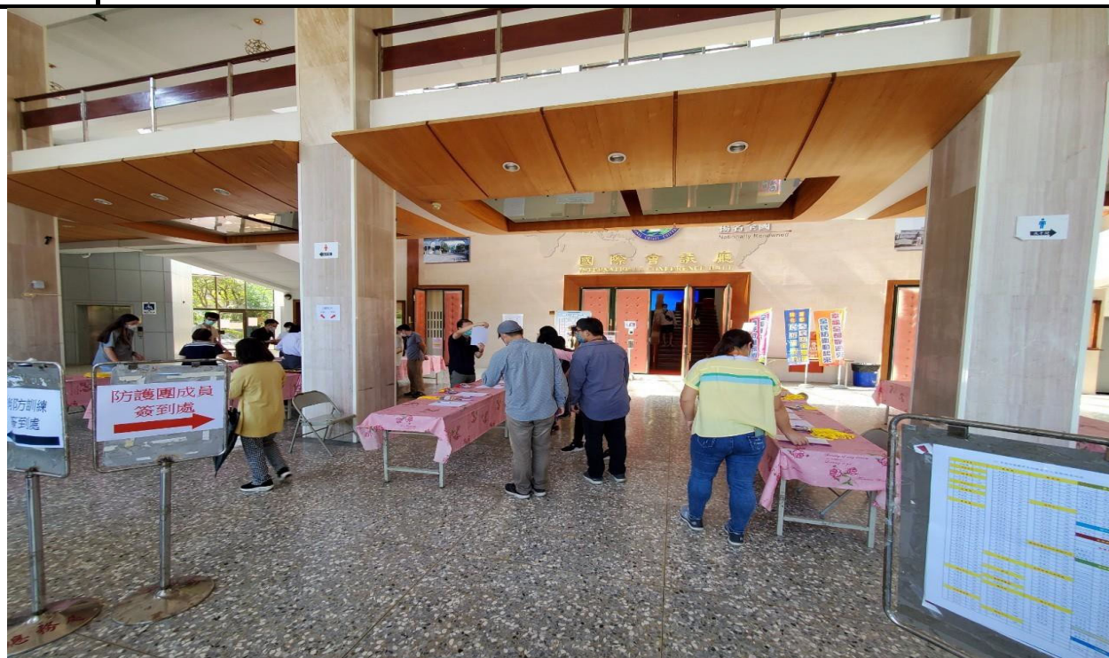
說明：本校防護團成員參加訓練簽到情形