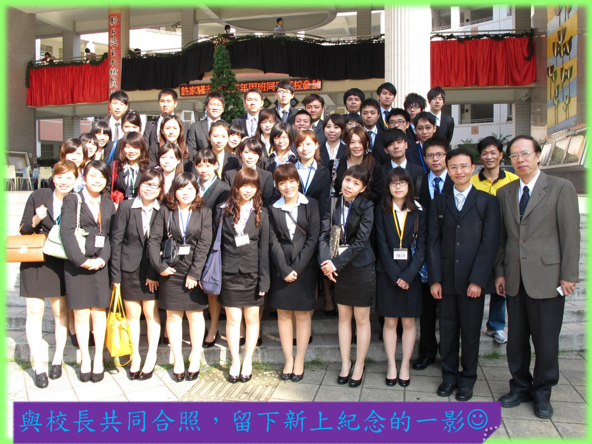
與校長共同合照，留下新上紀念的一影😊