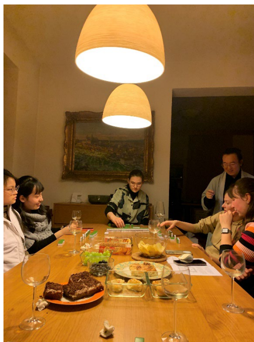
圖為去學生家學打麻將

有幾次我們也去到學生家，做台灣菜給他們吃，更特別的是我們在捷克與學生們一起學習如何打麻將。