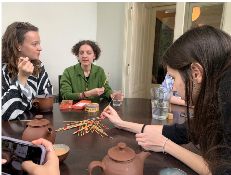
與學生在桌遊店一邊玩桌遊一邊用中文對話

除此以外，我認為可以自由的選擇上課的地點，這件事情也很棒，因為在上這堂課的過程中學生多次與我提到他們認為教室對他們而言其實富含壓力 若是可以透過這個方式一方面減輕學生的壓力，一方面更能夠促進他們學習並且說出中文，對於正在學習中文的他們也是一大益處。