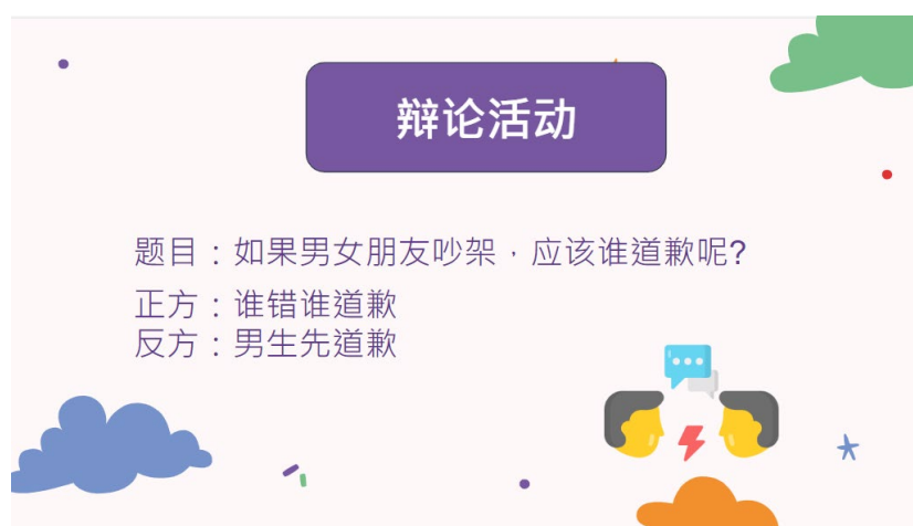
圖為三年級課堂教材中之設計活動 - 辯論活動

動，像是三年級的部分，我們就有設計一個辯論大賽我們透過與課程內容相關的主題，進而讓他們在課堂中進行辯論活動，透過這個活動除了可以增加他們的興趣以外，也可以有效地讓他們運用自己的所學來說出自己的觀點。二年級的部分則是設計更多較為簡單的練習或開放式問題，讓他們可以利用主課學習到的單詞進行回答。