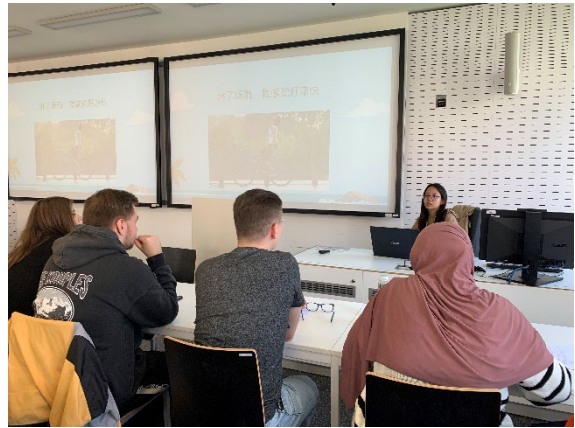
左圖為二年級的學生上課狀況，右圖為三年級學生上課狀況