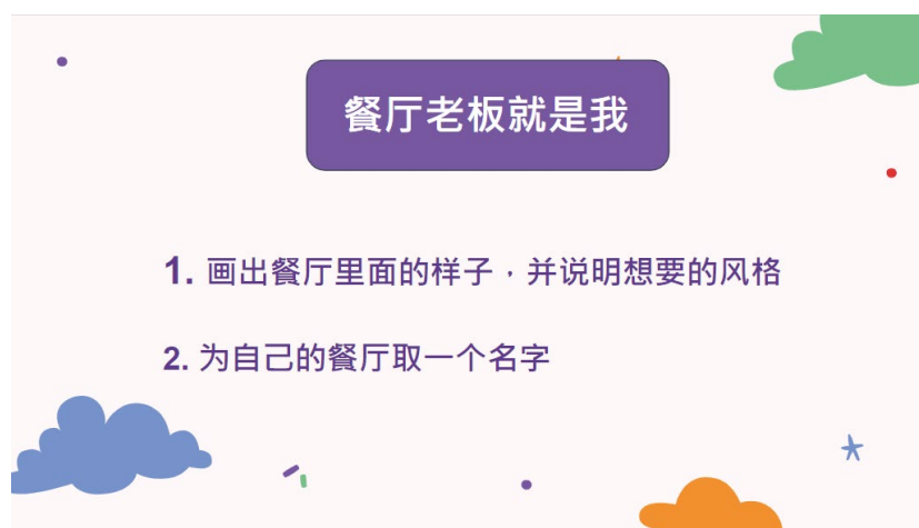
圖為課堂教材中之設計 – 創意繪畫

除此之外，在教材的設計上，我們為了避免讓學生感到太過無聊，因此我們也有設計一些繪畫的活動，讓他們可以在上課的過程中，不會那麼無趣，當然學生對於這些活動的回饋都很好，也因此讓我在教學上信心大增，不再害怕。