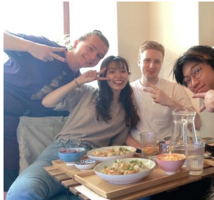
左圖為電影之夜觀看飲食男女，右圖為與學生相約蒙古餐廳之交流文化