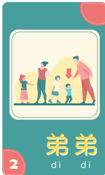
字卡不同詞性、單字設計