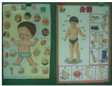
「我的身體」海報和「身體」掛圖