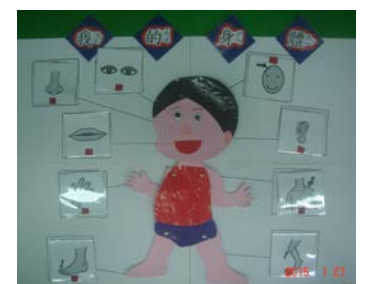
自製教具：「我的身體」黏貼式掛圖