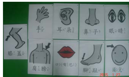
自製教具：身體各部位圖卡