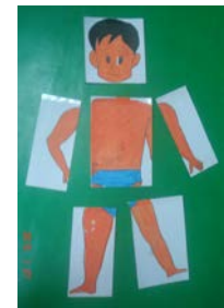
自製教具：人體拼圖