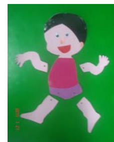
自製教具：手腳可活動式紙人偶