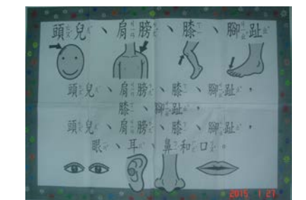
自製教具：頭兒、肩膀、膝、腳趾海報