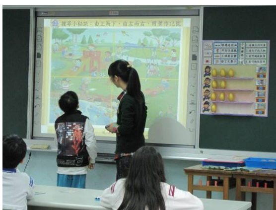
學生上台進行搜尋