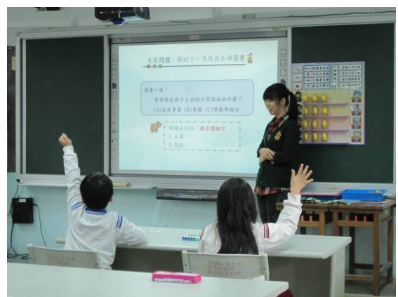
活動四：看問題找答案