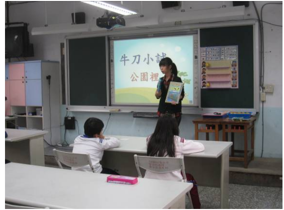
教師發下學生操作板