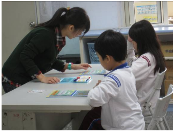
教師進行個別指導