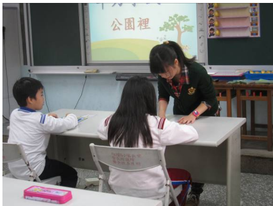
教師進行個別指導