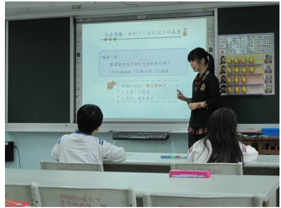
教師檢核作答結果