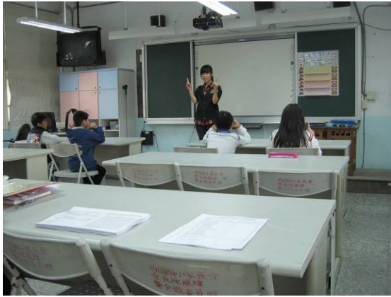
教師帶領做頭腦體操