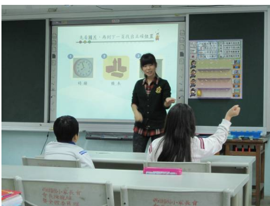
活動一：看圖片找位置