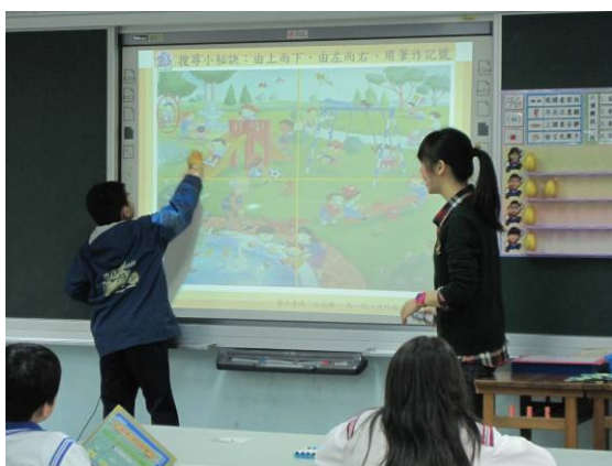
學生上台進行搜尋