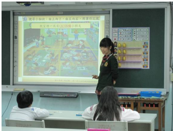
教師進行示範搜尋