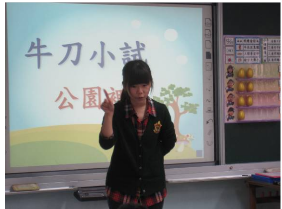
教師說明操作要點