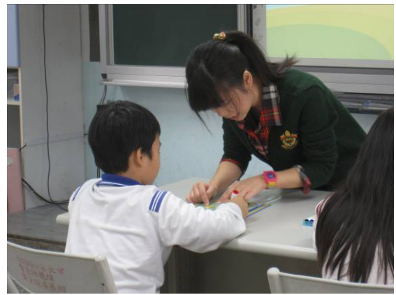
教師進行個別指導