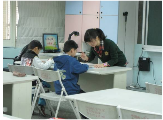
教師進行個別指導