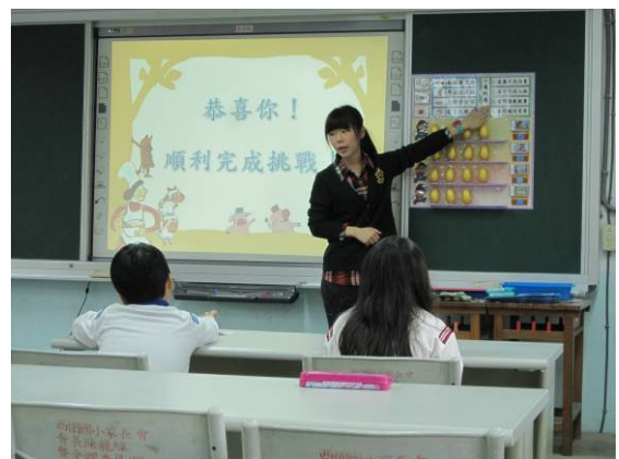
回顧課程活動內容