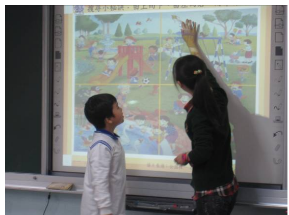
學生上台進行搜尋