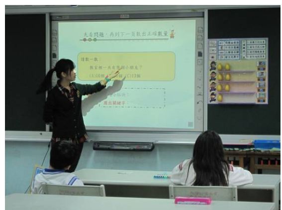
活動三：看問題數數量