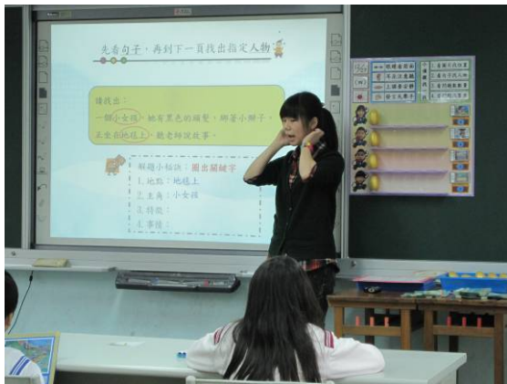
活動二：看句子找人物