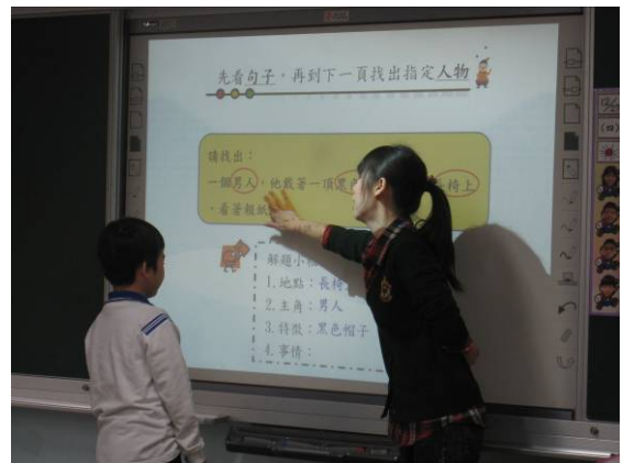
學生上台圈出關鍵字