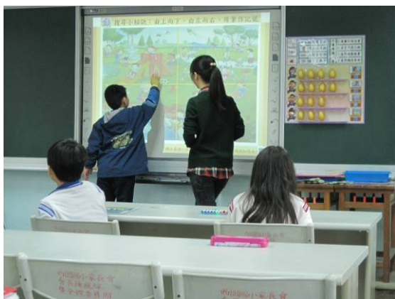
學生上台進行搜尋