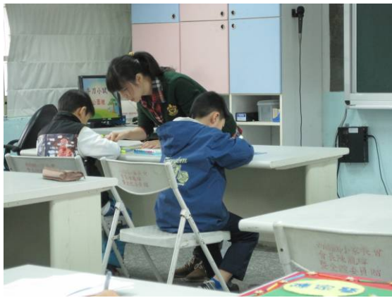
教師進行個別指導