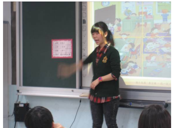
教師進行示範搜尋