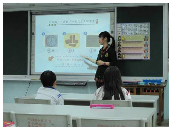
解題教學：字首記憶法