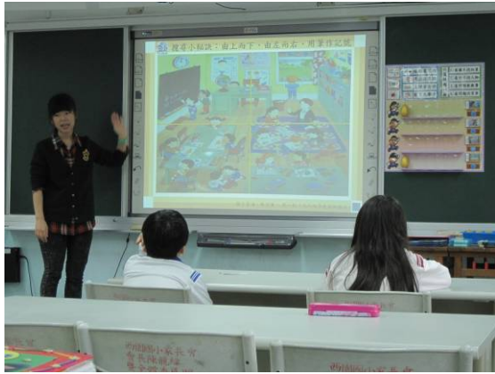
教師進行示範搜尋