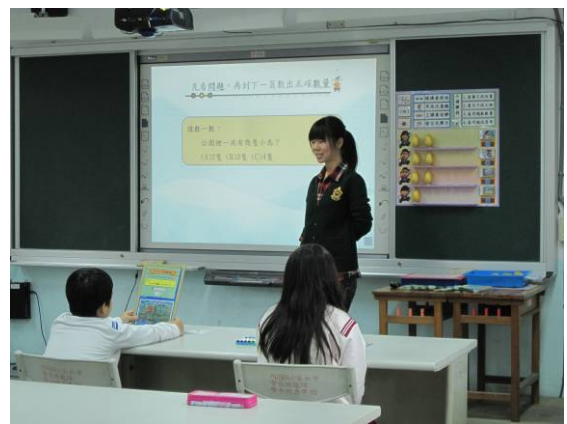
教師檢核作答結果