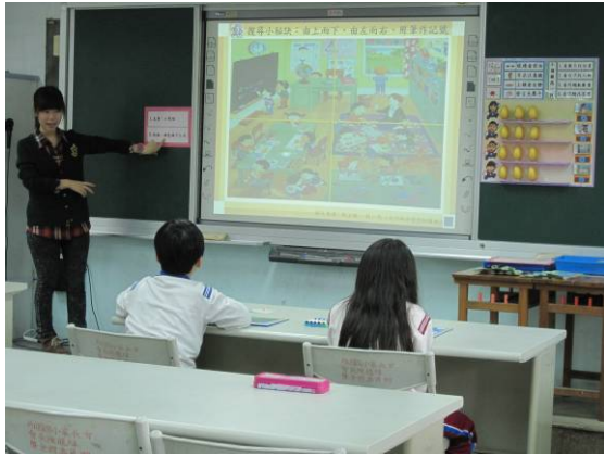
教師進行示範搜尋