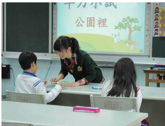
教師進行個別指導