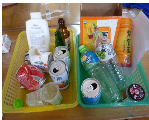
資源回收物品實例