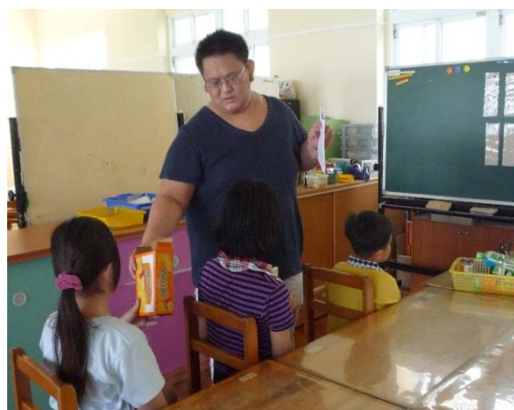
學生觸摸資源回收物品了解特性