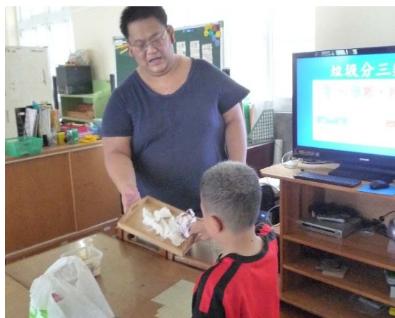
學生進行垃圾分三類的活動