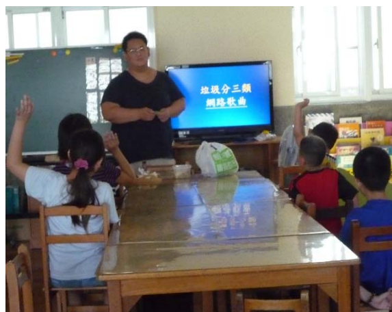
教師呈現垃圾分類歌曲詢問問題