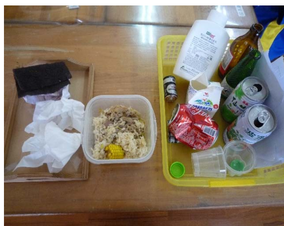
垃圾分三類實際物品