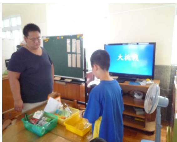
學生進行資源回收分類