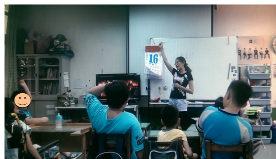
學生輪流舉手發表歡送會當天想要吃甚麼食物