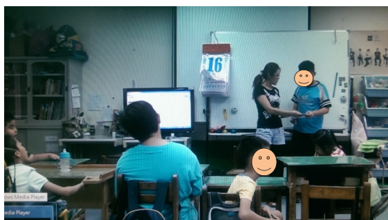
高組學生擔任司儀，並逐字唸出司儀稿