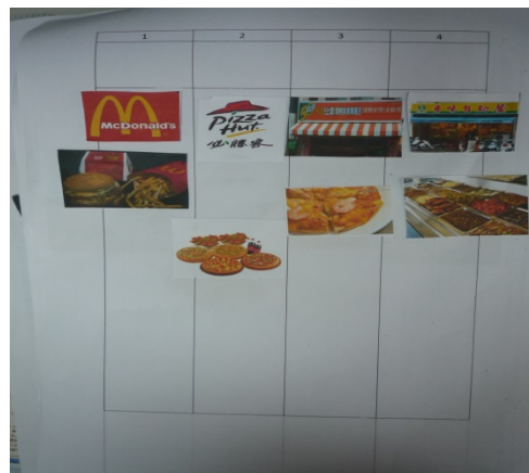
選票製作，透過老師的引導及提示下，學生表達出歡送會想要用餐的食物內容，老師再將食物內容列印下來，讓學生自己貼上，完成投票用的選單。此節課在藝術與人文課程中完成。