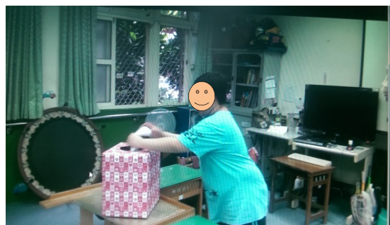
能力佳的學生自己蓋章後，將選票投入投票箱