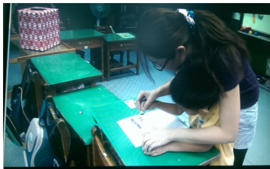
學生在部分協助下完成投票蓋章的活動