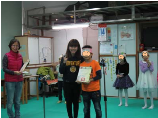
星光大道師長頒獎