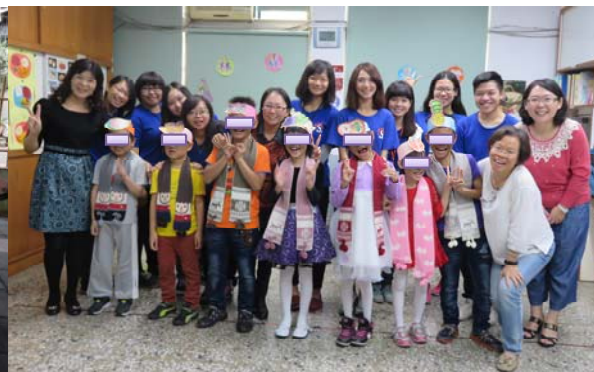
校長及嘉義大學師生觀賞本劇排演後合影