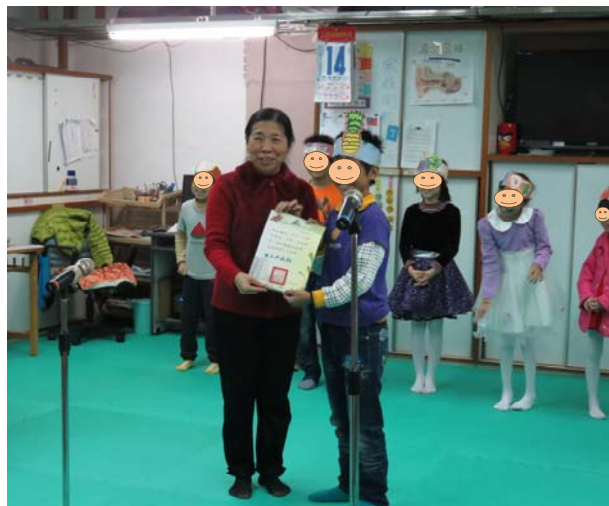
星光大道師長頒獎