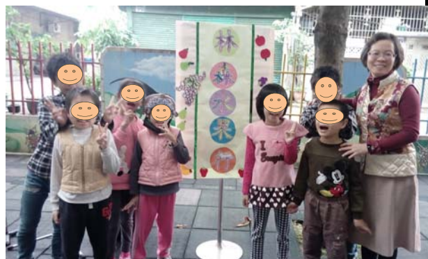
林森水果行招牌完成了