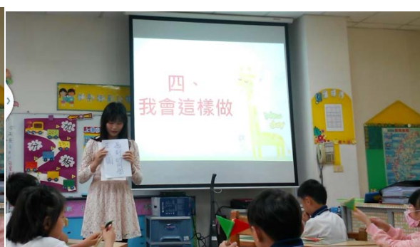
第四部份：我會這樣做，解說題目卡內容