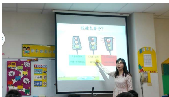
說話距離具體化為紅綠燈示