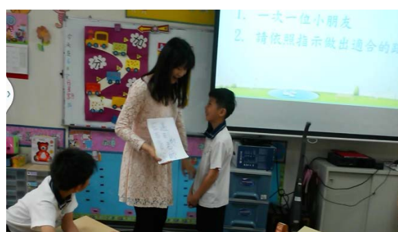
學生到前面實際演練