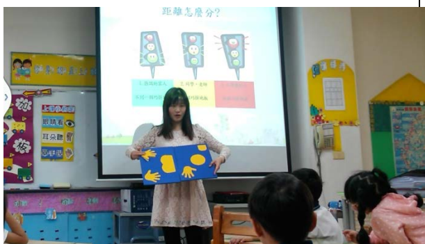
以巧拼地墊解說距離概念