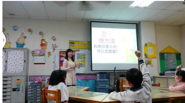
第三部分：我會想方法，請學生發表