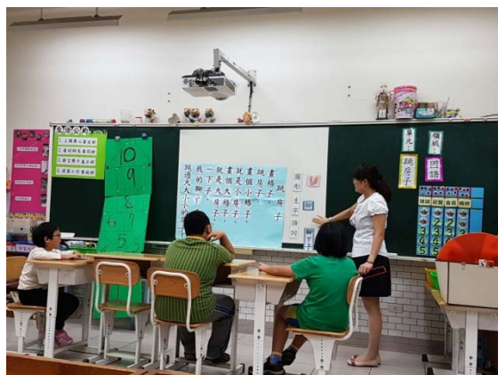
彩色圖卡搭配字卡進行教學