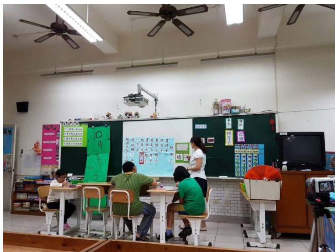
識字板讓學生操作與書寫