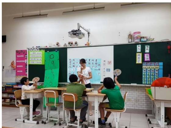
運用大型字板搭配課文遊戲及大字報進行課文朗讀