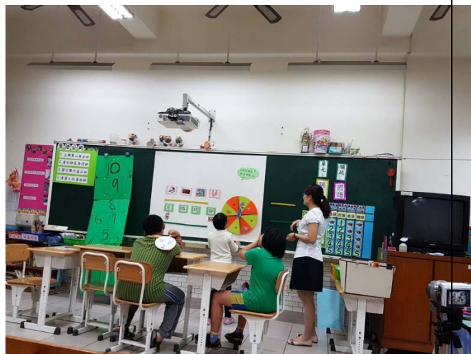
運用部首旋轉盤增加教學多元評量