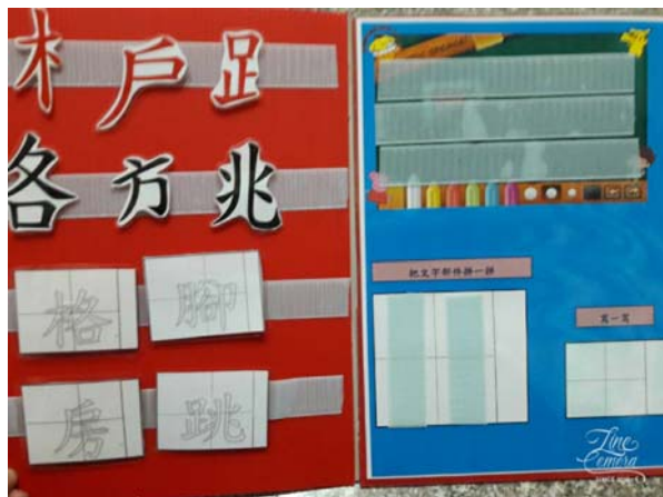
識字板內容依顏色提示，並依學生需求設計內容