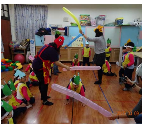
小動物們開始進入氣球關門關卡