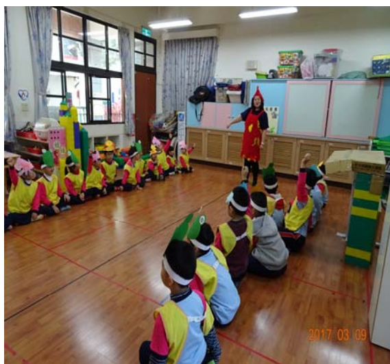
故事時間-瘋狂馬戲團