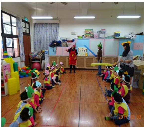
魔術氣球關門遊戲規則說明示範