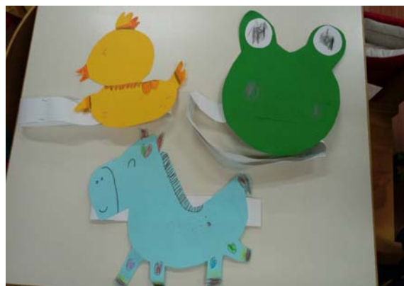
完成三種動物頭套