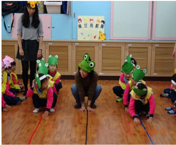
青蛙跳躍的動作示範