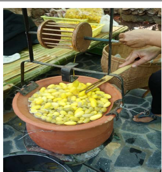
照片八、用竹片挑出絲的脈絡