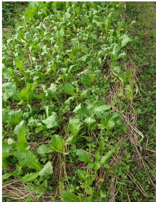
照片二：用稻草鋪油菜田