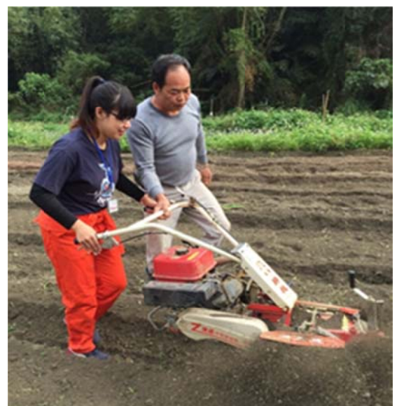
團員正用心的學習操作中耕機