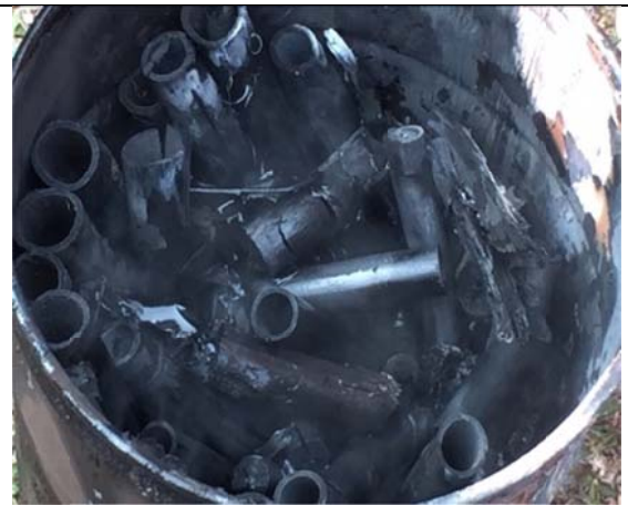
黑碳農法-由竹炭燒製成的生質炭