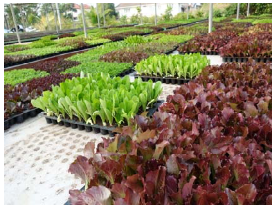
照片十：等待移植的苗