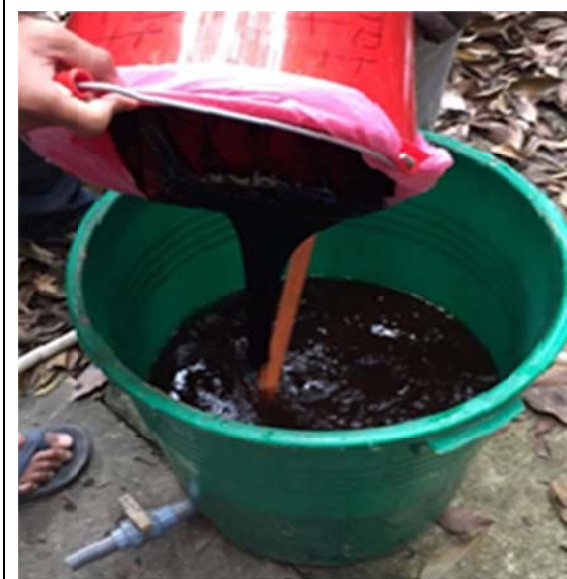
加入適當比例的糖蜜