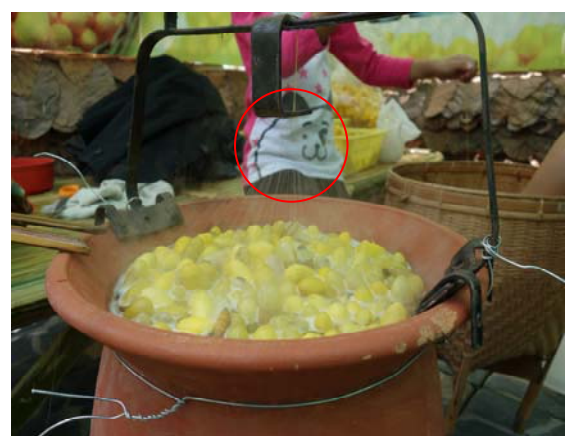
照片十、一根根的絲結成一束