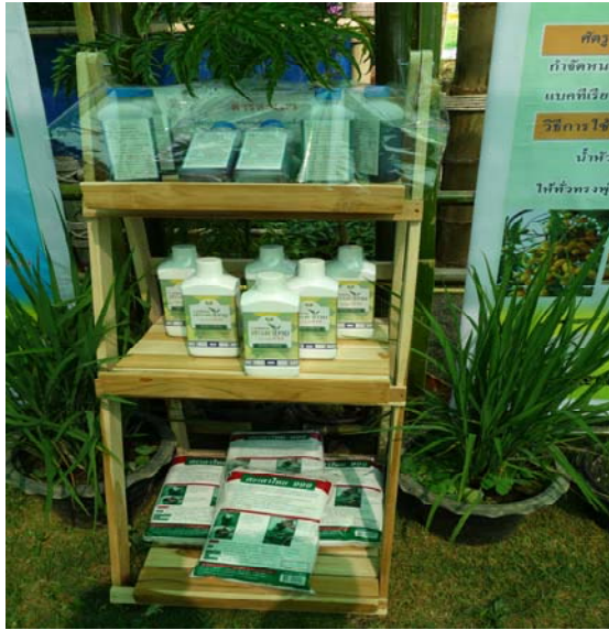
照片一、不同劑型的生物製劑