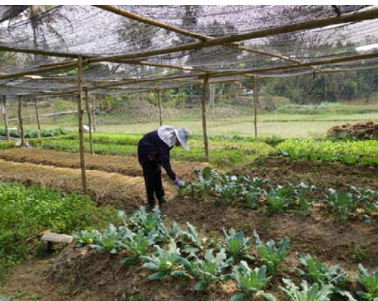
照片五：有機小菜園