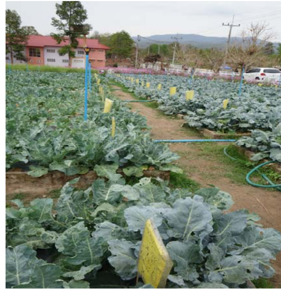
照片二、懸掛小菜蛾黃色黏板