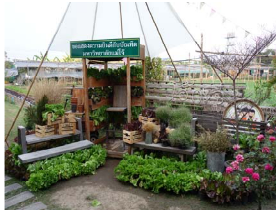
照片十二：裝飾藝術