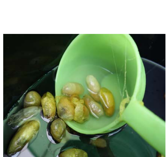
照片十二、繅絲後的蠶蛹