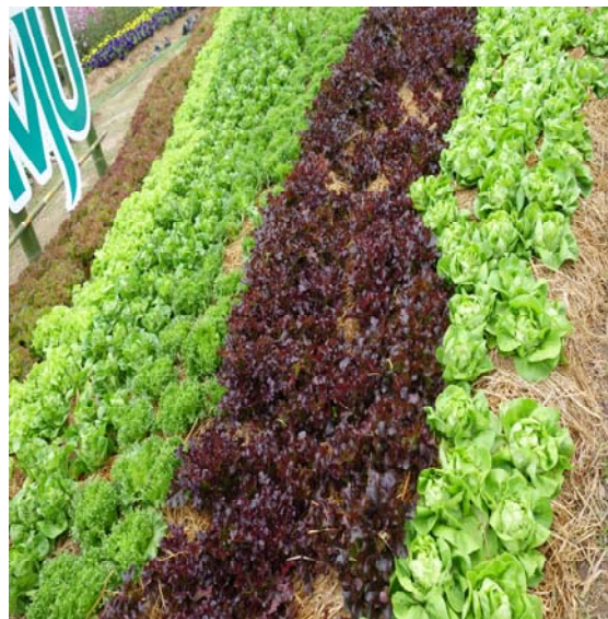
照片四、覆蓋稻草的萵苣種植