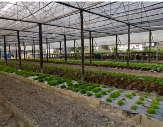
照片十一：萵苣菜園