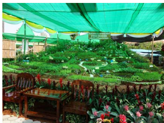
照片六、高山的農業模型