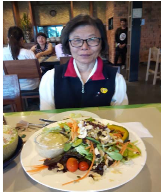
照片八：一大盤有機沙拉