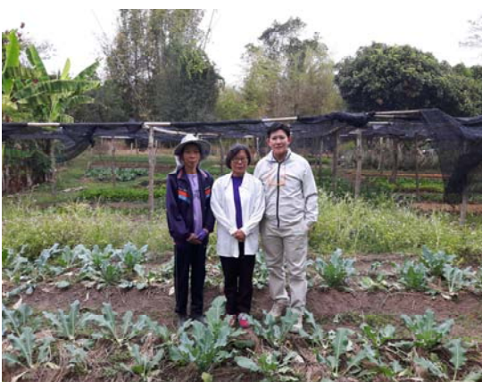
照片三：與農民及湄洲大學教授〈作者之一〉參觀有機農場