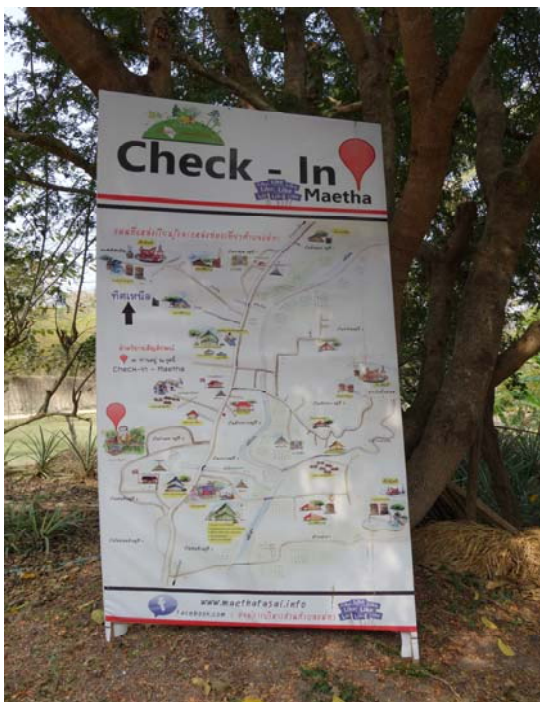
照片一：有機農場示意圖