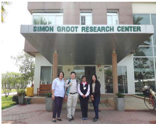
照片四：參觀種子公司與研究人員合影