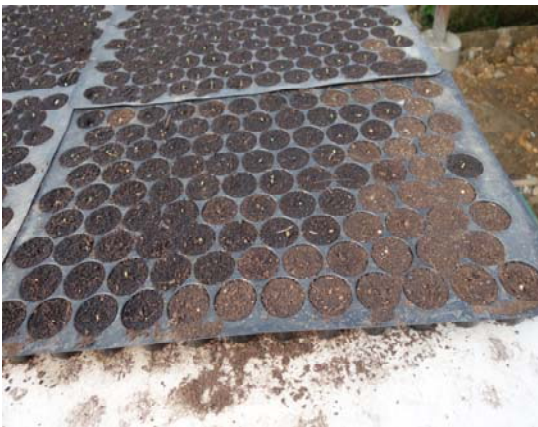
照片九：有機餐廳的萵苣育苗