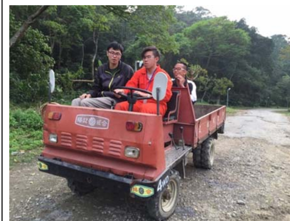
同學親自操作搬運車