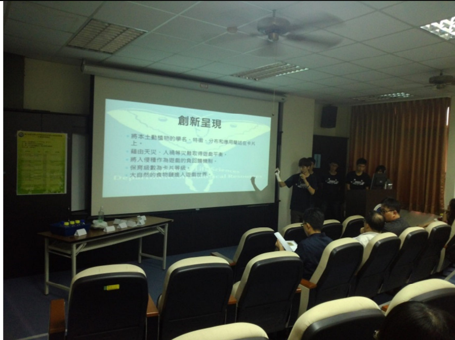
第一組:森之魂-挹注在卡牌上的生資魂

業競賽，期能活化學生團隊的創意及研發技能，整合創新技術和思維，成功申請創業補助資源，以期未來能嘉惠國內產業發展，創造產學雙贏局面。在此次的校內創業競賽中，各個創業團隊的表現均十分亮眼，每個創業團隊在台上報告時，在台下的團隊亦專注聆聽此團隊的簡報，彼此團隊的輔導老師與學生間更互相切磋與交流，感受到老師與學生間對彼此團隊創業計畫的尊重與認可。