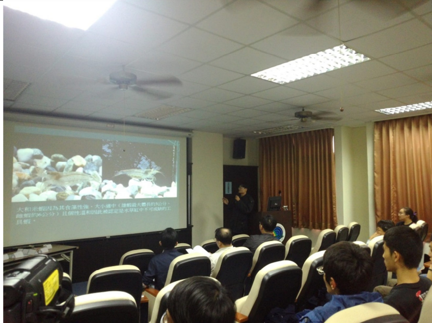
第四組:大和米蝦( Caridina multidentata )大量工廠化繁殖技術