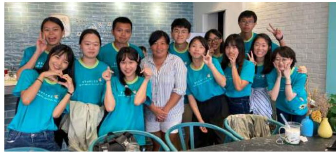
▲ 與馬祖高中生及大浦 Plus 夥伴們共同企劃如何保存在地文化。

可曾想像「回家相聚」這件事在馬祖人身上是多麼的艱辛可貴。在外地留學的青年、在外地掙錢的壯年、大家都在異地夜以繼日的打拼著，有人是為了夢想、有人是為了三餐溫飽、更多人是為了良好的生活品質。僅有一間大學的馬祖，使得學生想尋求更好的教育資源，不得不到外地讀書，畢業之後，也就近尋找工作機會。隨著時間的流逝，對馬祖的眷戀也一點一滴慢慢地消失，正是馬祖所遇到的瓶頸。