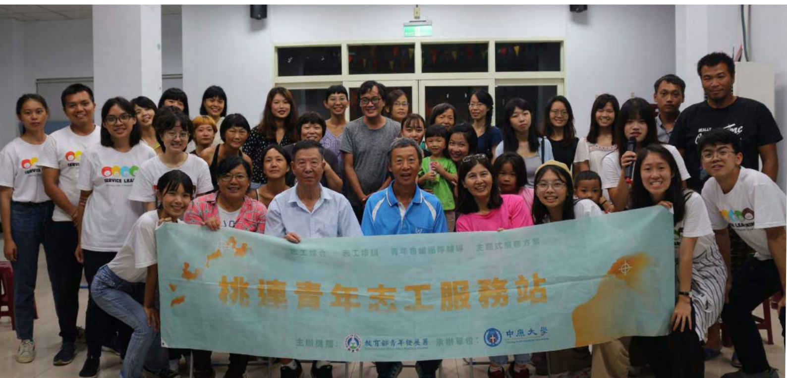
▼ 紀錄片「洄」播映日，與馬祖居民們共同留影留念。

採訪的結尾，問到V落客成員對這次馬祖之行的收穫時，他們微笑地說：「服務結束後也許不會記得馬祖的風景有多美，但會永遠記得當地人有多美。」他們回憶到籌備初期，自己對馬祖的印象如教課書記載般受限，但在實際瞭解馬祖後發現還來得更更有溫度。親耳聽到馬祖高中的學生說出：「原來家鄉有這麼豐富的文化資源！」，也開始意識到文化傳承的重要與使命。對此，團隊明白一切的可貴，都是來自服務成果被受眾肯定。不熟悉自身家鄉的文化成為團隊的共同體悟，V落客從異鄉人的視角，看見他們眷戀馬祖的情感，將這份觸動，化為對傳承文化的使命感，以此為契機，開始積極參與家鄉舉辦的傳統活動，也希望將這份精神，延續在下一代的心中。