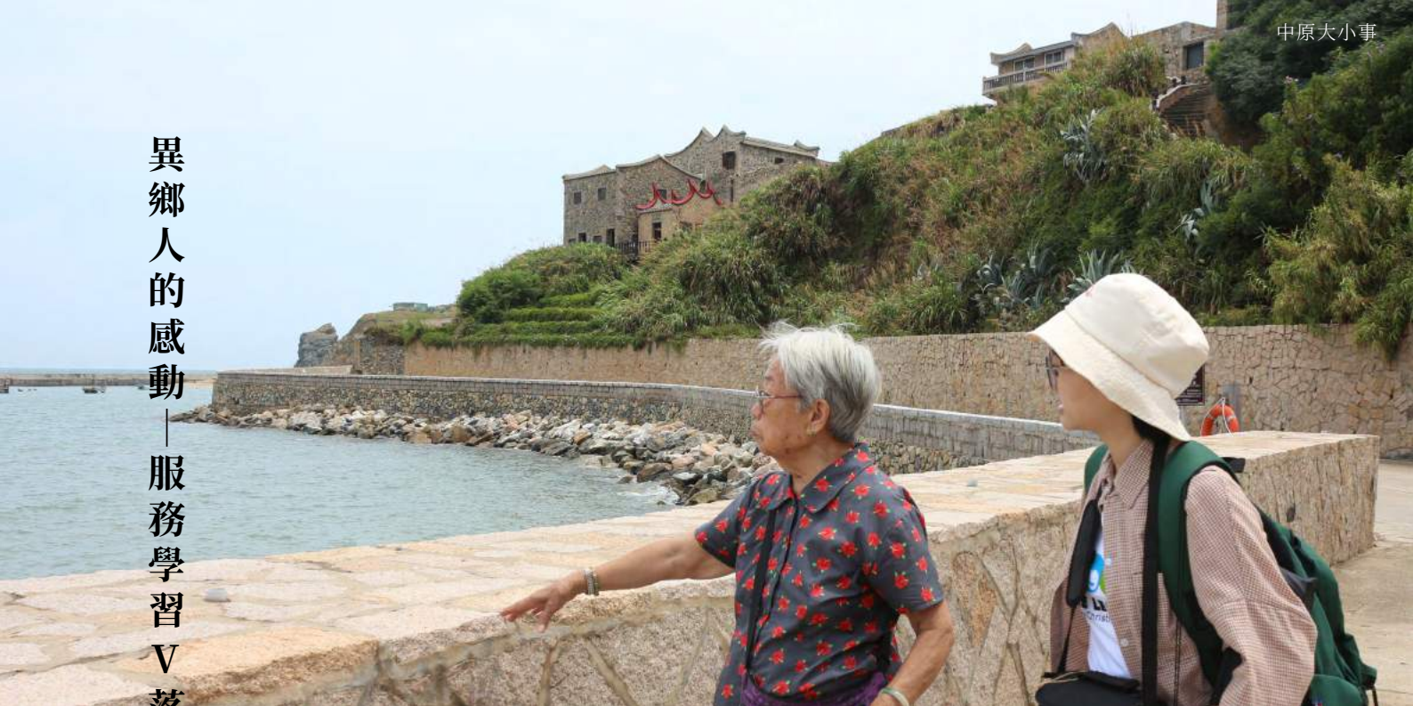
▲ 細細聆聽馬祖耆老們對擺暎祭的過往記憶。

有一群人選擇拿起他們手中的相機，跨越海洋，距離臺灣 114 海里的島嶼，展開為期兩個禮拜的探訪之旅。並將感受到的溫暖，拍攝成一部又一部的紀錄片。他們是一中原大學服務學習 V 落客團隊。