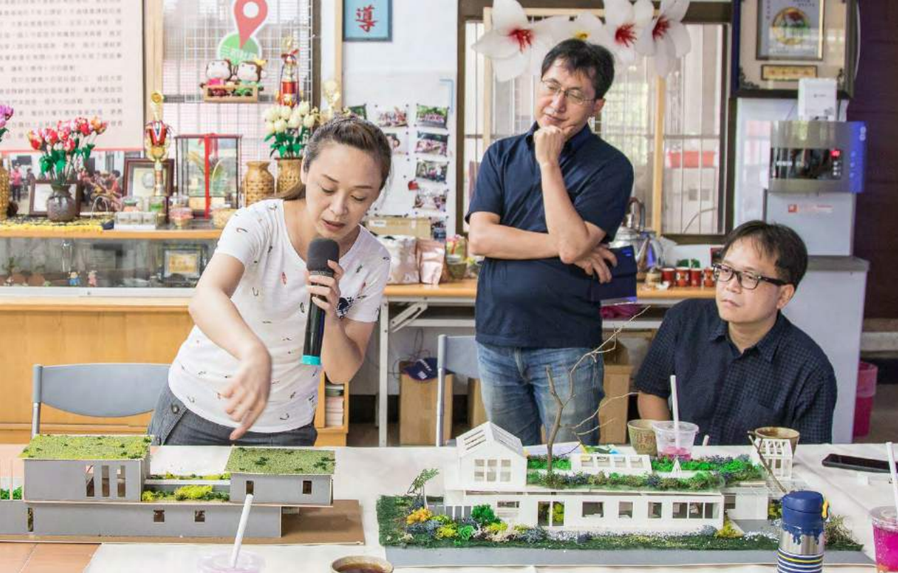
◀ 學生解釋對於三和社區創作的作品。