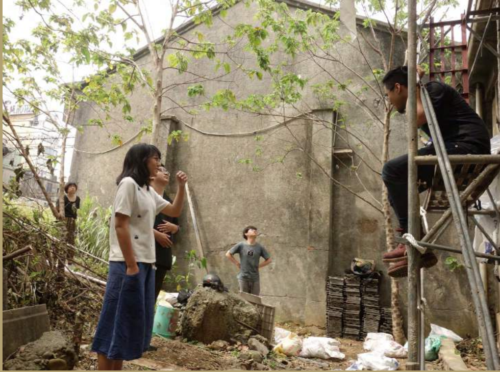
▲ 火車看台的打造。重建者老們過往的回憶。

每個地方都需要做夢的人， 但當這個夢想一直提出去， 卻沒有辦法被實現的時候， 那就會很痛苦， 也是我們離職的原因。