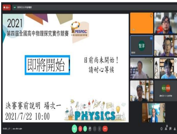
蘇炯武教授參與賽前會議