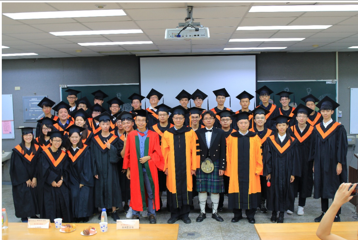
師長與畢業生合照