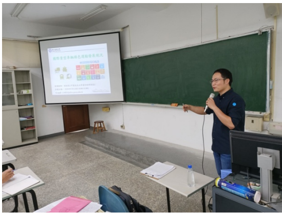
講者開場與自我介紹