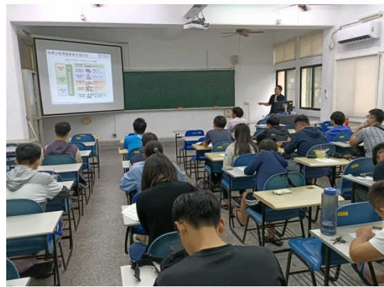
講者介紹我國公路運輸節能計畫