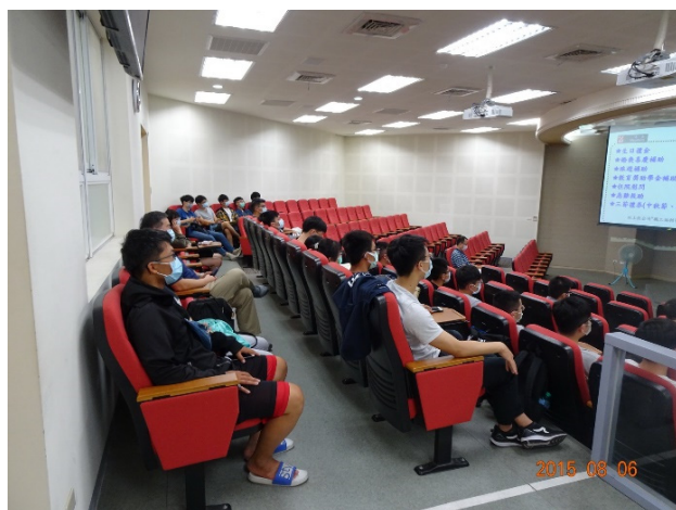
參加英濟公司實習說明會的學生及老師