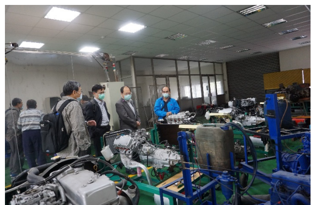
訪視委員參訪教學設施