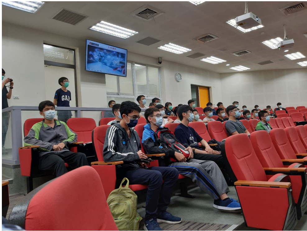
參加英濟公司專業校外實習說明會的學生