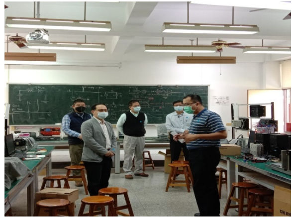
主任帶領委員參觀實驗室