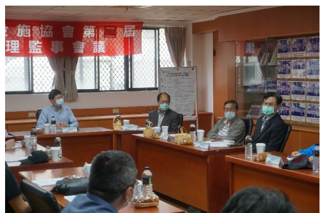
訪視委員與生機系老師進行座談