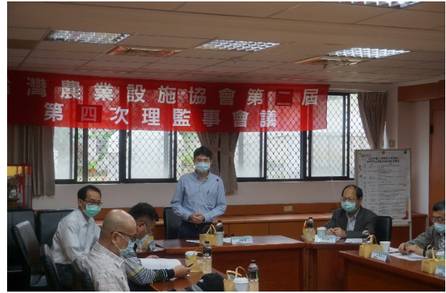
理工學院院長蒞臨