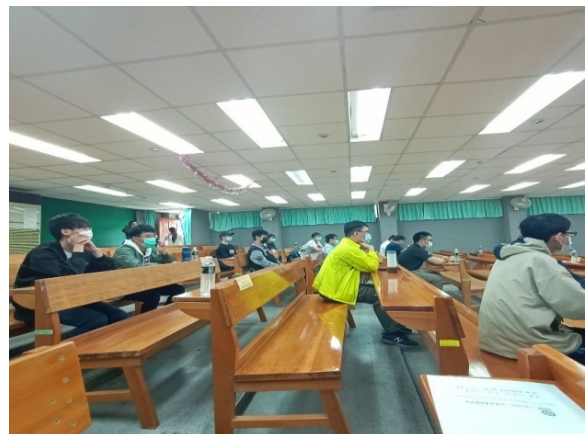
各班代表與畢業生代表參加座談會議