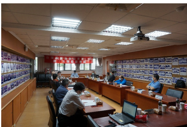
訪視委員與生機系老師進行座談