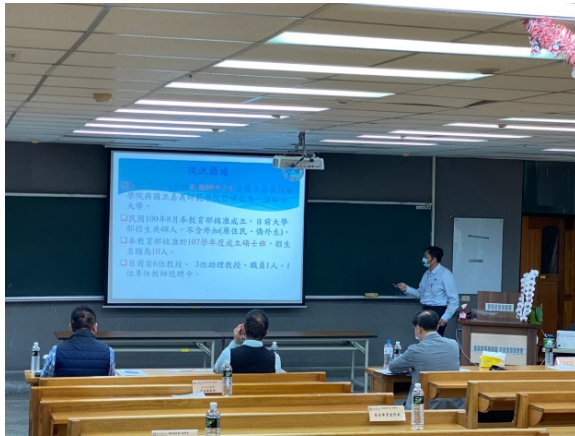
主任簡報本系業務