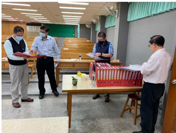
委員審查書面資料