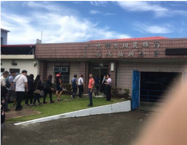
進入九曲堂抽水站參訪