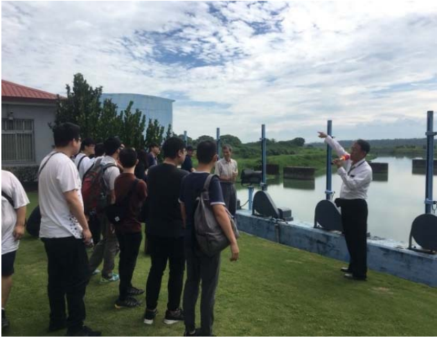
站長介紹水閘門運用