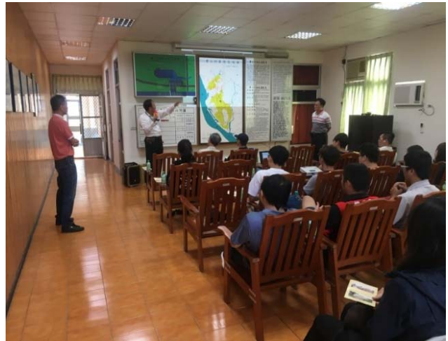
九曲堂抽水站站長簡報