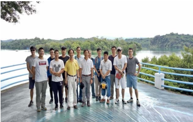
烏山頭水庫大合照