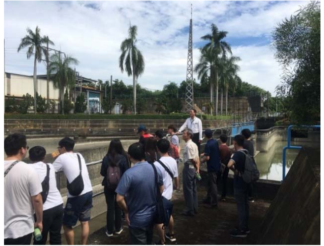
站長解說沉沙池運用