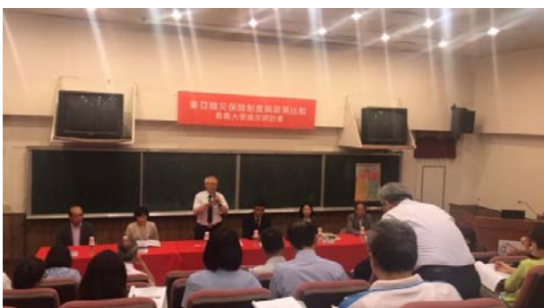
艾群校長於研討會中致詞