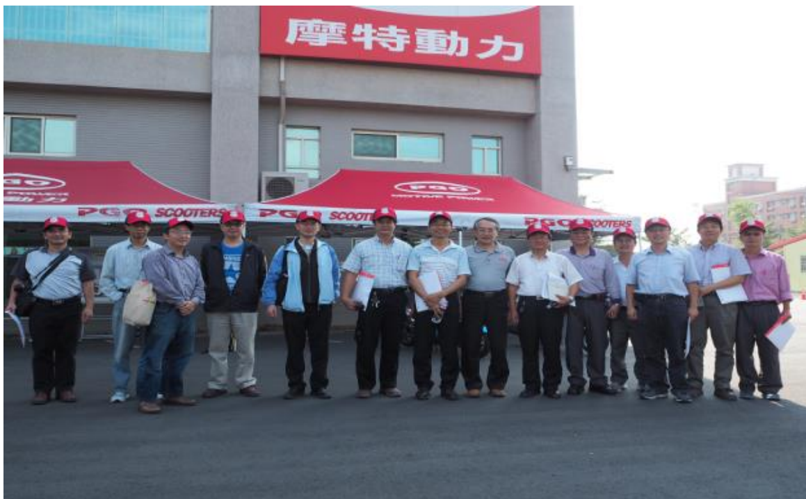
教授團於 PGO 研發大樓合影