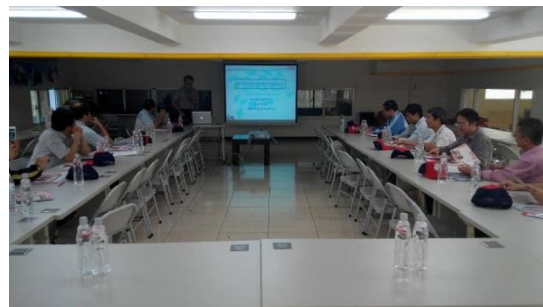
PGO 與本院教授團進行產學推廣交流