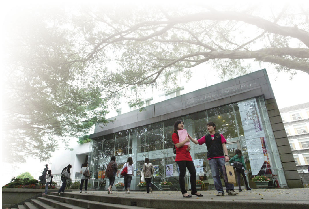
▲引導學校發展辦學特色，是100年度辦理大學校務評鑑的目的。