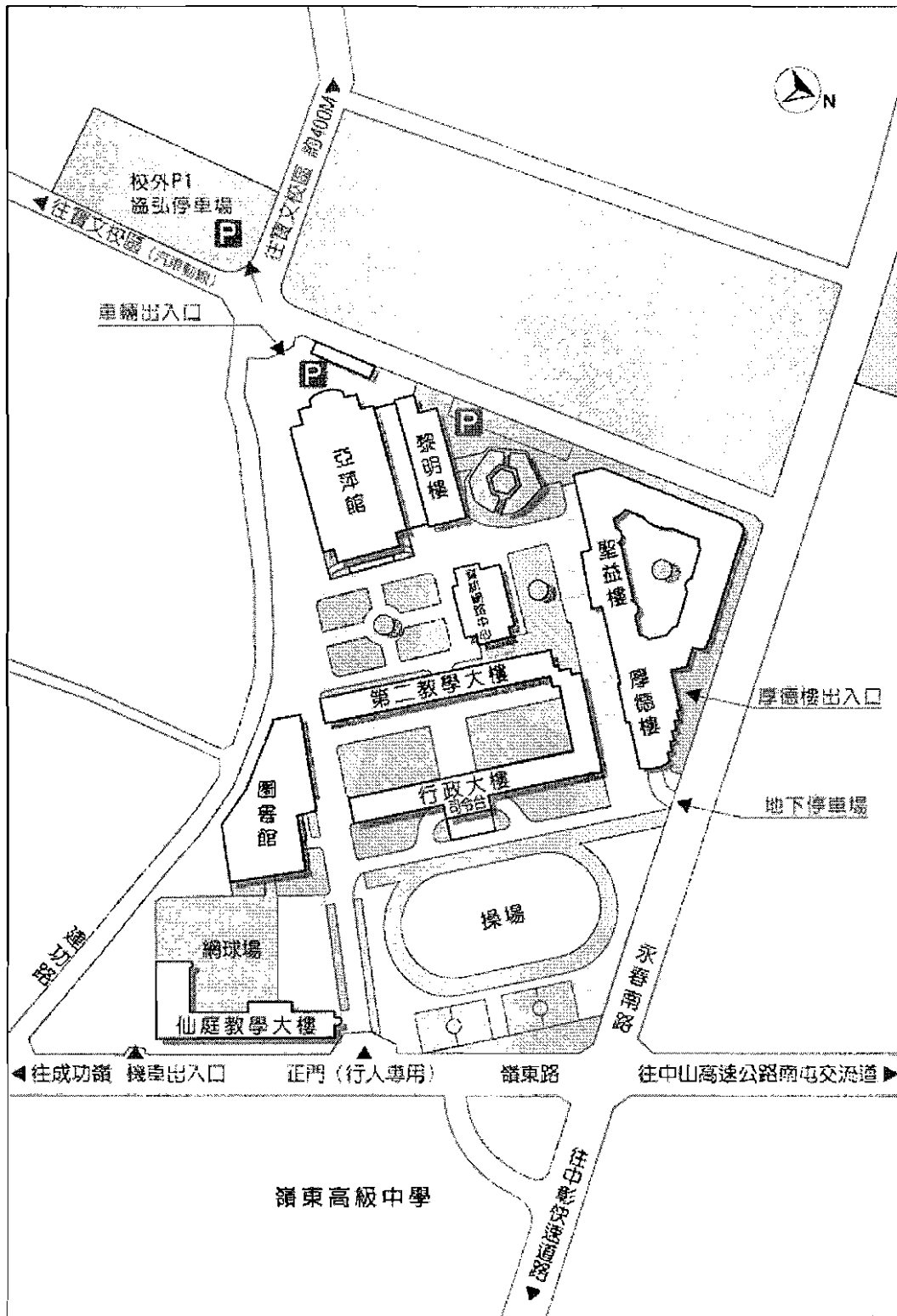
嶺東科技大學春安校區平面配置圖