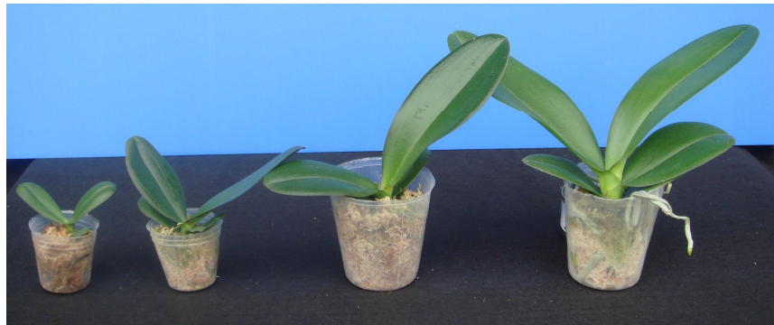
出瓶苗 1.7吋小苗 2.5吋小苗 2.5吋中苗