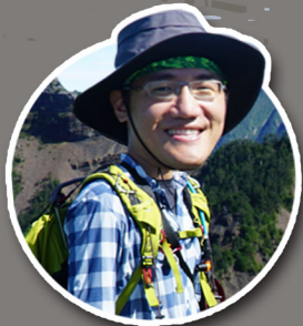
作者 董威言 (城市山人)