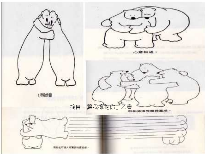
摘自「讓我擁抱你」乙書