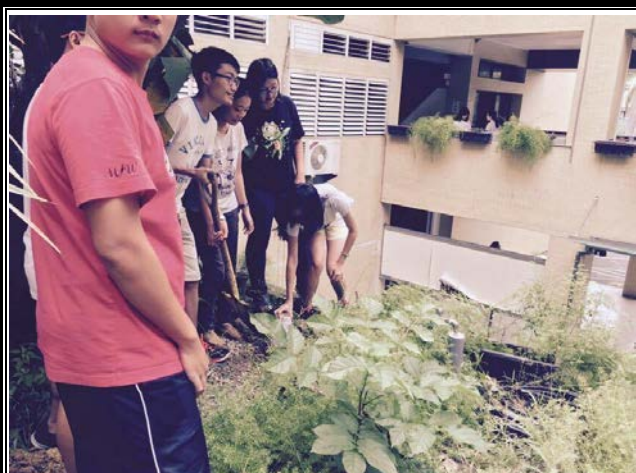
將瓶中信放入洞中