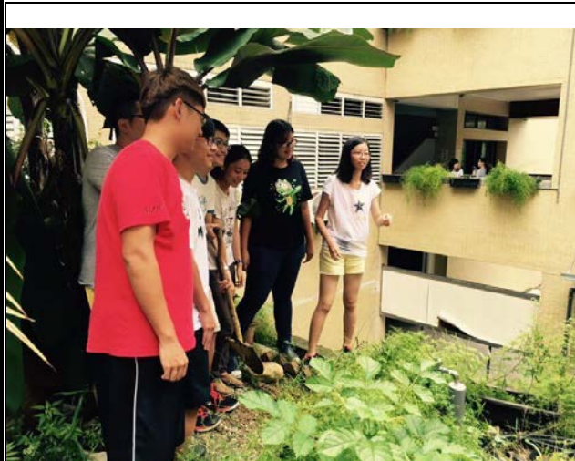
幾位代表一起在約定的地點合照