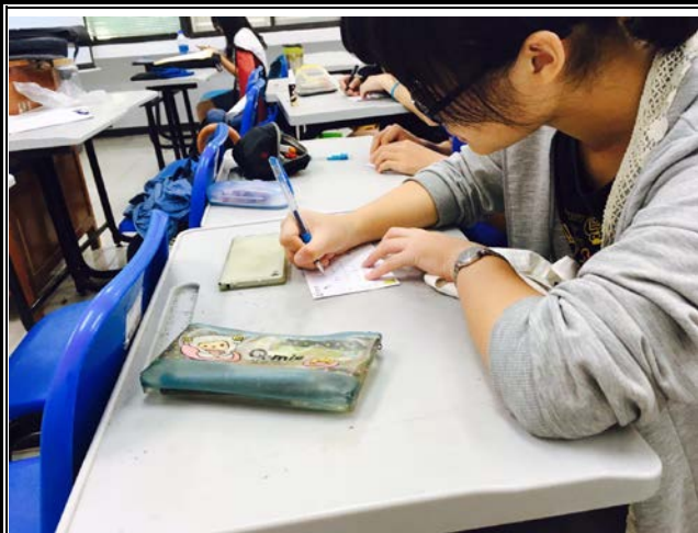
寫下對自己大學生活的期許