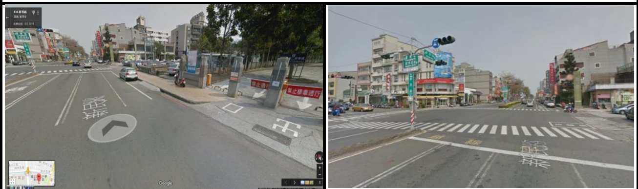
新民校區(新民路側門路口)，同學機車請勿逆向。