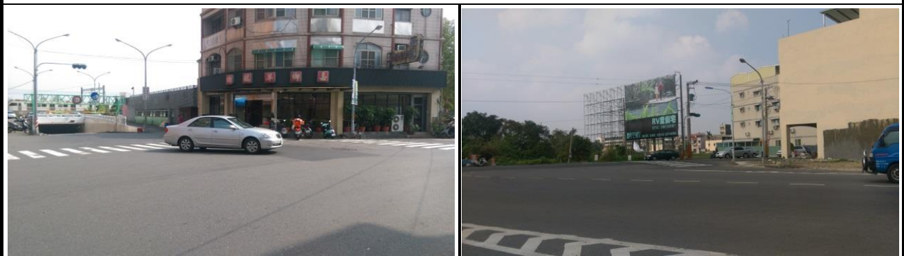
民雄校區(文化路陸橋及地下道口)