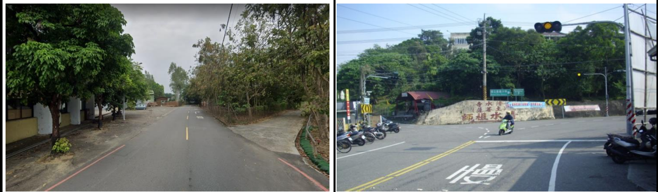
蘭潭校區(林牧路及清水祖師路段)