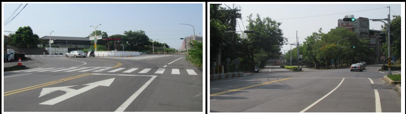
蘭潭校區(彌陀路忠義橋及學府路口)