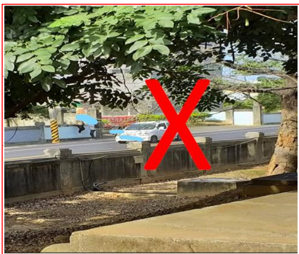
違規樣態：攀爬鐵門或圍牆進出學校

(五) 民雄校區創意樓文化路側門並未對外開放 ，但有部分同學為圖方便將機車停放於校外違規爬牆進出校園，提醒同學此處車流多常發生意外，請同學自保將機車停放在校內機車停車場， 並由校門口進出 ，確保用路以及自身安全。