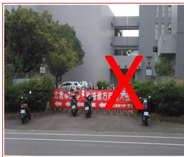
違規樣態：機車未依規定位置停放