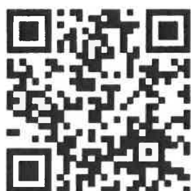
生命橋樑助學計畫影片介紹

邀請符合條件的你(妳)申請生命橋樑獎助學計畫，共同成就這一項以服務精神應用於事業及社會的扶輪計畫。