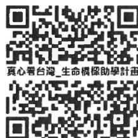
真心看台灣節目介紹生命橋樑計畫