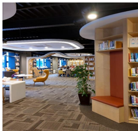
蓋杰圖書館內部空間