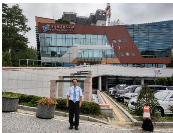
議政府市科學圖書館全貌

議政府市設有4座公共圖書館，本次參訪議政府市科學圖書館(Uijeongbu Science Library)以及蓋杰圖書館(Uijeongbu Gajeul Library)。議政府市科學圖書館於2003年啟用，除了科學書外，還設有天文宇宙體驗室、無重力4D體驗室。在此可以聽取有趣的星座相關講座，或進行在 宇宙保持均衡、無重力4D體驗等富有特色的宇宙體驗。