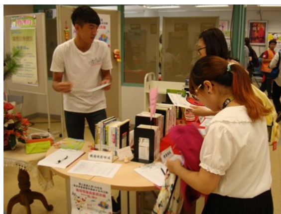
工作人員回答參觀者問題