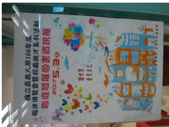
106年職涯發展圖書資訊展活動

Readable Catalog)資料 93 筆。該聯盟由全國各大學及研究機構圖書館組成，部分經費由教育部補助，參與該聯盟有助於本館編目系統與國際接軌，並安排本館同仁與國內外圖書館同業交流，以及參與該聯盟舉辦之教育訓練課程。