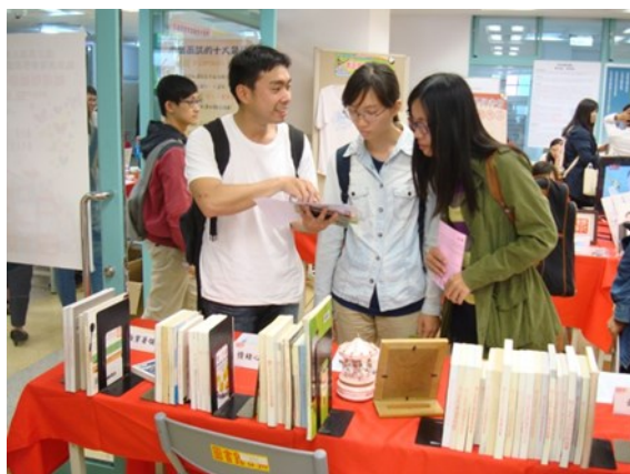
參觀學生相互討論書展清單