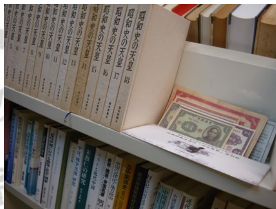
日本慶應義塾大學山田辰雄教授部分贈書資料