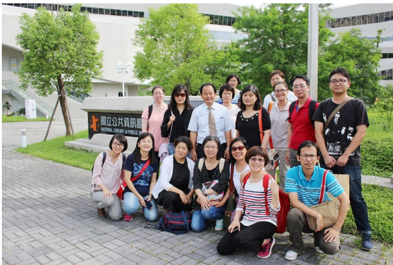
圖10 國立公共資訊圖書館前館員大合照

4.其他特別創意：戶外電視牆影片欣賞、館前廣場提供街頭藝人表演及開放大廳場地提供不同單位展覽規劃等。