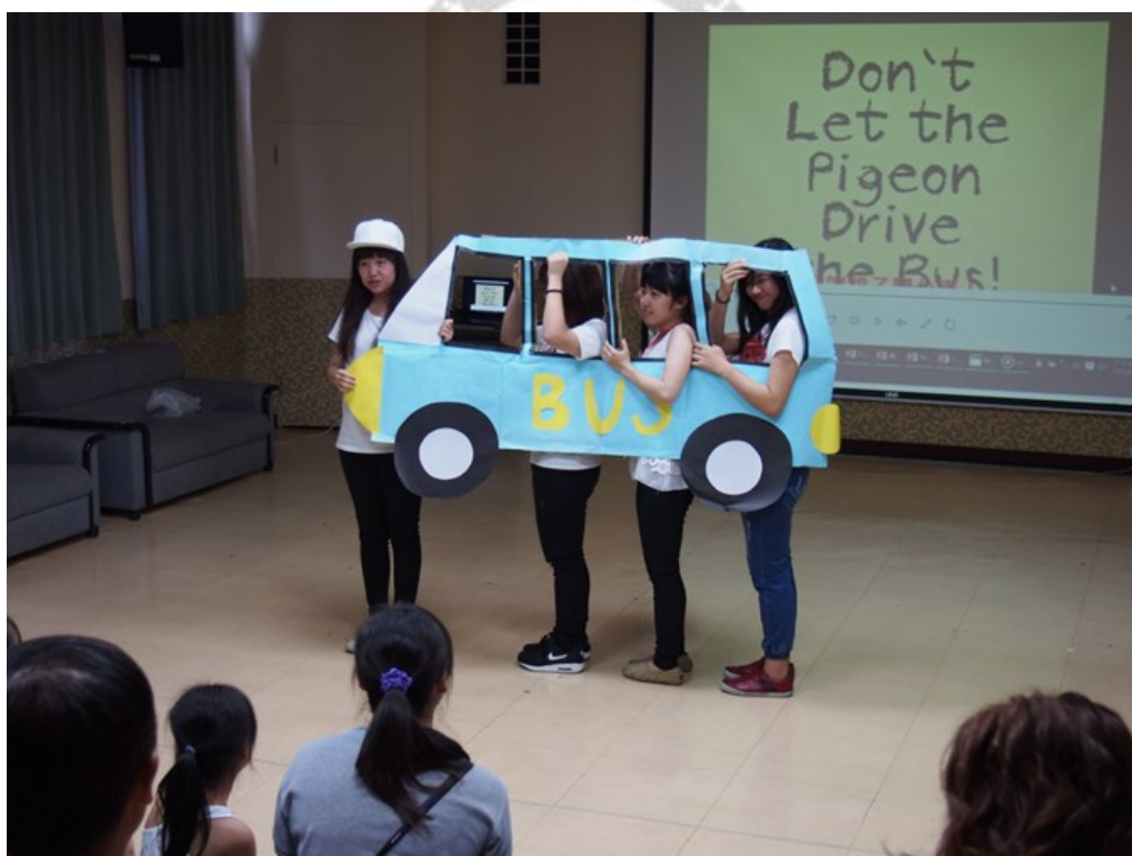
圖3 西文繪本改編迷你戲劇

目前民雄校區圖書館的中文童書近3萬冊，英文童書則約5千冊，童書內容包羅萬象，有小說、童詩、故事、散文、歷史、傳記、知識性書籍等等。豐富的館藏除師生教學上使用，附近社區民眾亦能入館共享。近年來外語系及教育系修習兒童文學相關課程的同學在任課老師指導下，