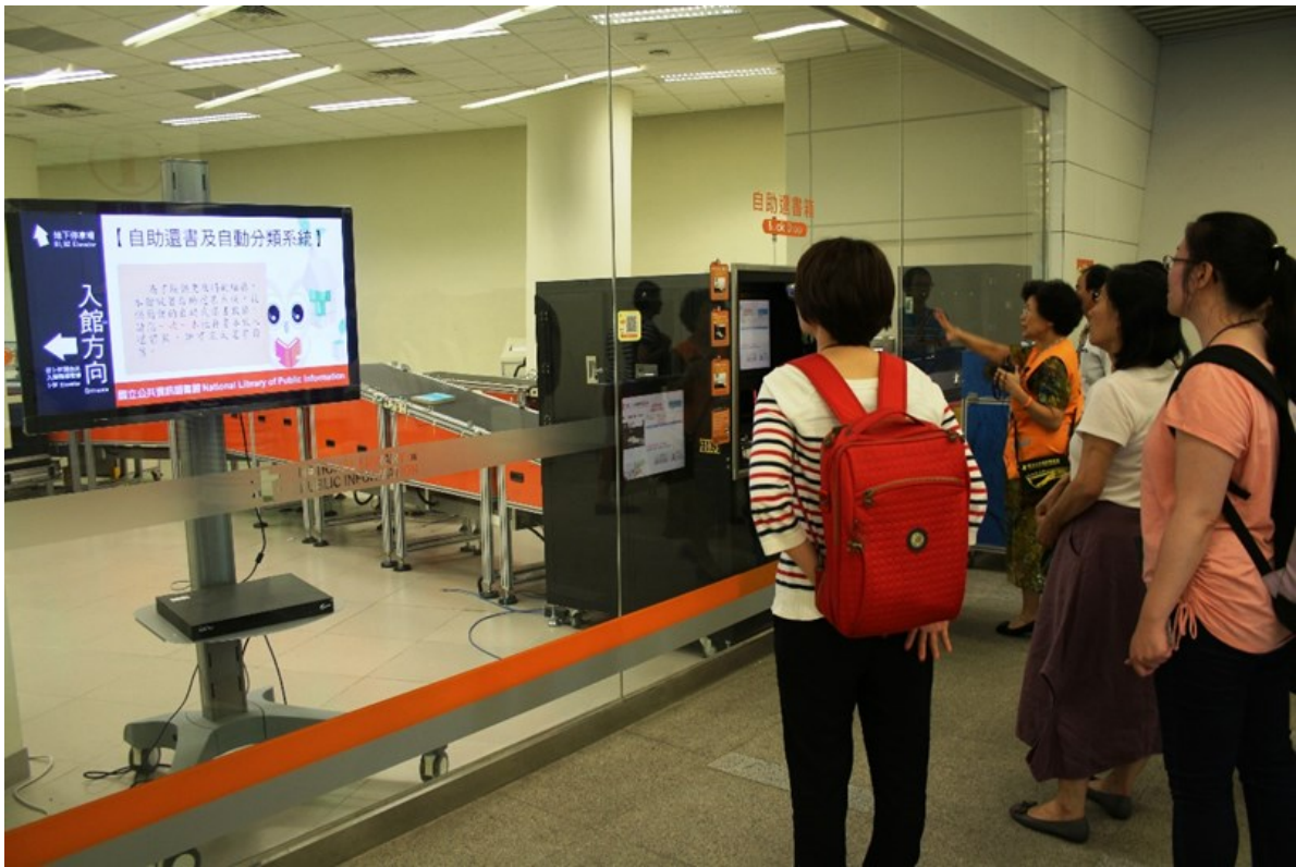
圖5 自助還書及自動分類系統