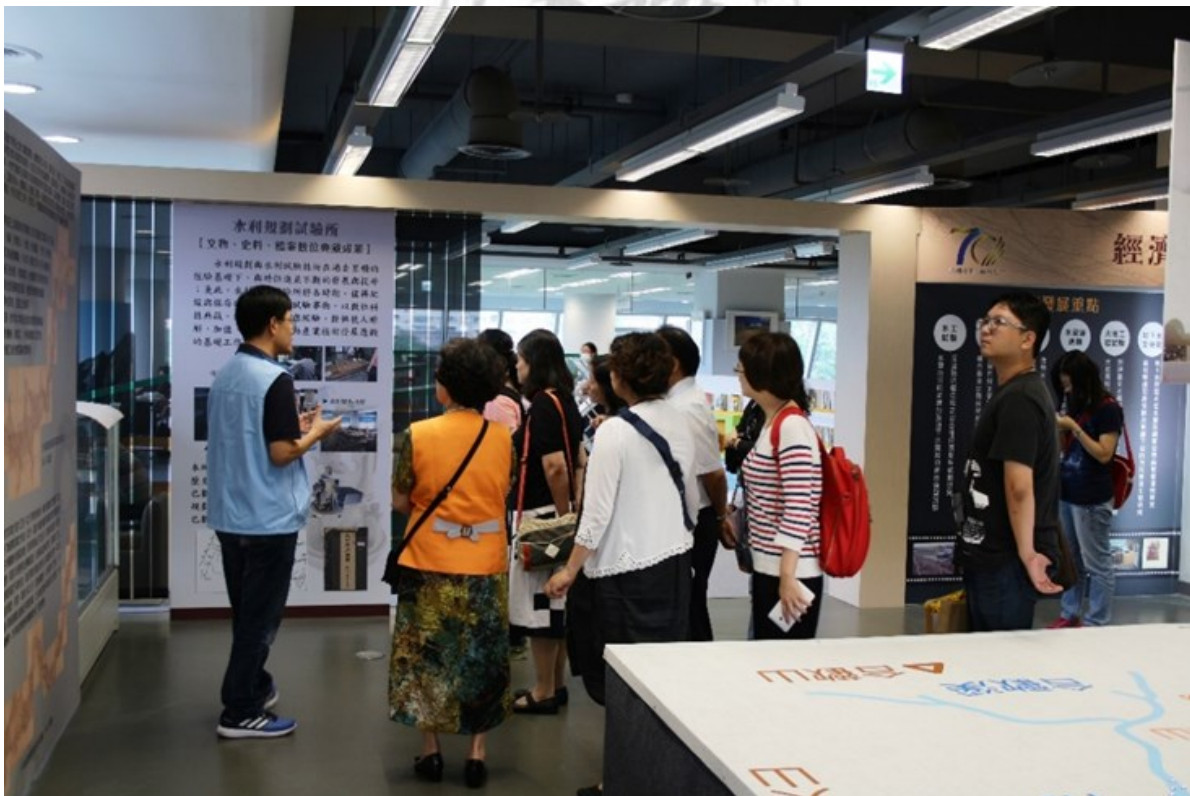
圖6 情規河處-臺灣水利規劃百年檔案展