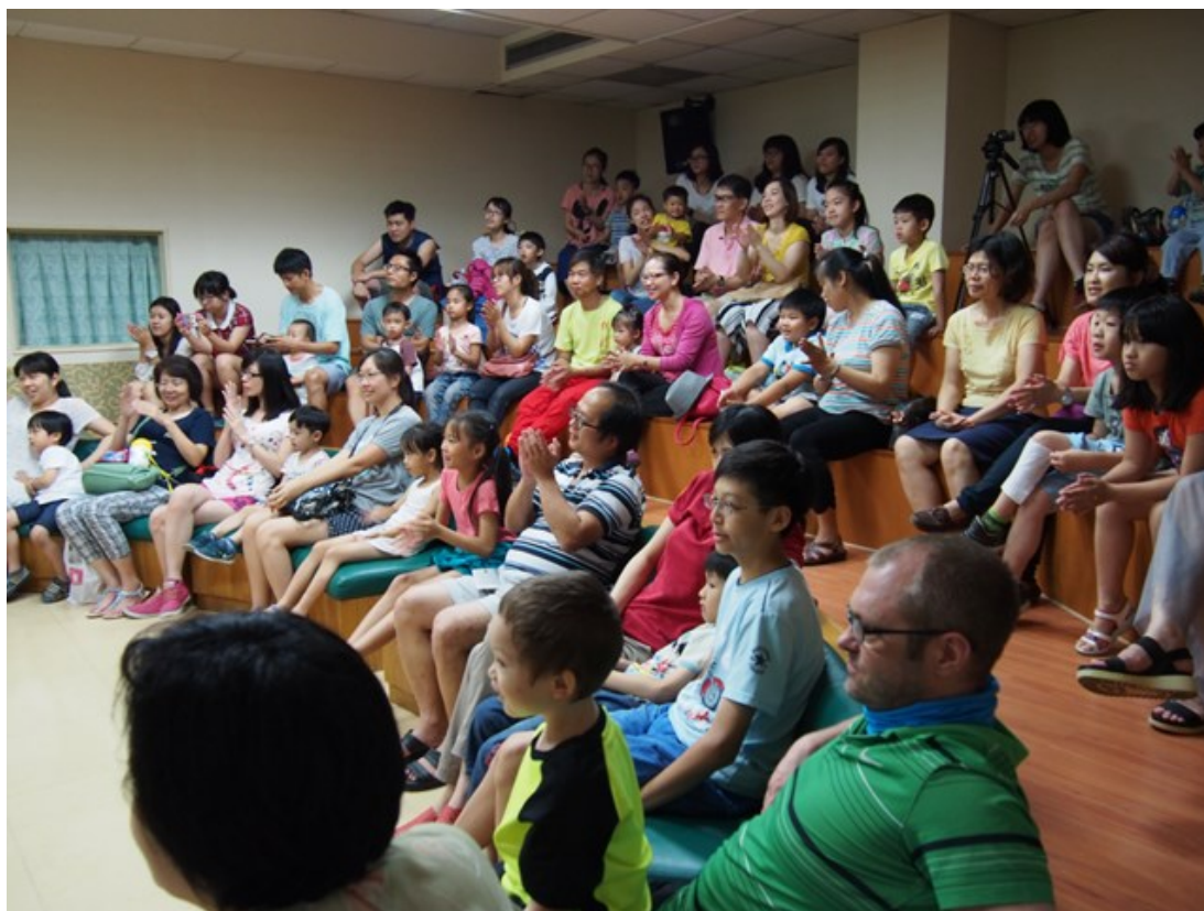
圖4 周末親子英文故事時間

選擇館藏中適合的西文繪本改編成迷你戲劇(圖3)，在學期末邀請社區民眾前來民雄校區圖書館參與周末親子英文故事時間(圖4)，寓教於樂。藉此活動民雄校區圖書館不僅提供嘉大學生學以致用的機會，更扮演友誼的橋樑強化了大學與社區的關係。