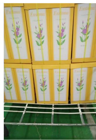
洋桔梗外銷日本外包裝