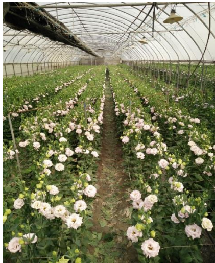
即將採收的洋桔梗植株