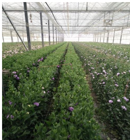
溫室單株密集式栽培洋桔梗切花