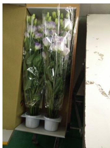
洋桔梗外銷日本之內包裝與保鮮裝置