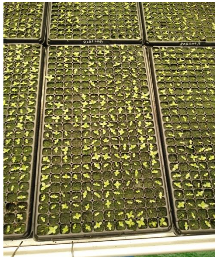
洋桔梗穴盤育苗情形