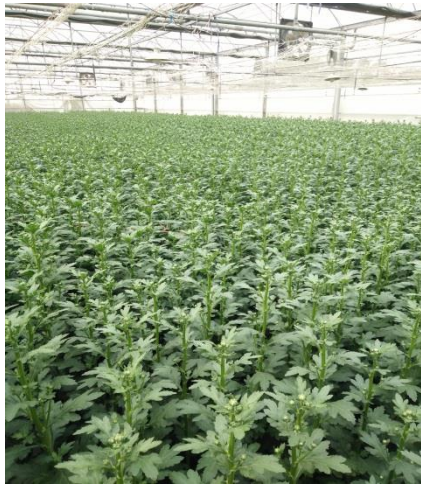
虎尾地區溫室栽培菊花切花