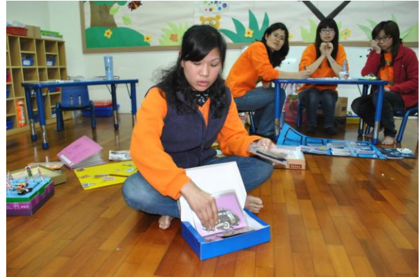
老師們思考後再將討論結果，利