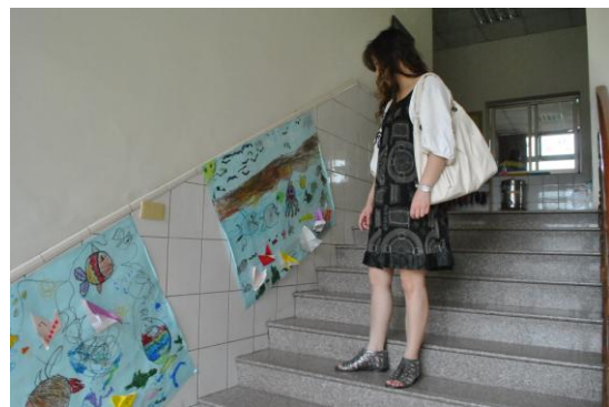
吳老師最後給予建議，仍要多以情