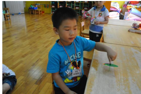
吳老師觀察孩子創作，孩子迫不及 往分享，甘制作過程與玩法。