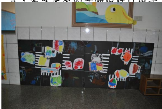
以孩子作品為主，呈現在環境