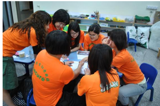
老師們分組進行研討，針對主題