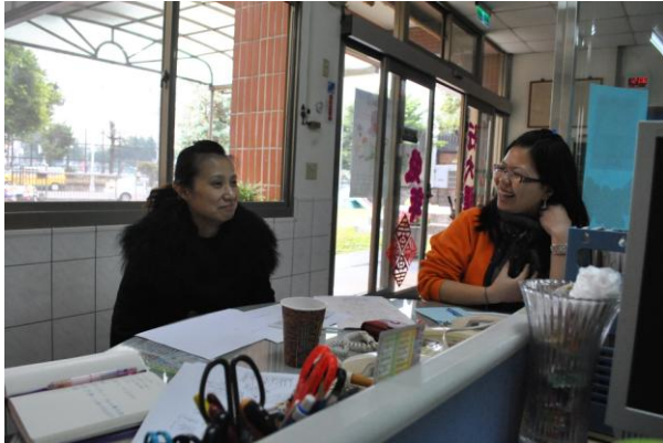
吳老師分享方式讓老師們更了解