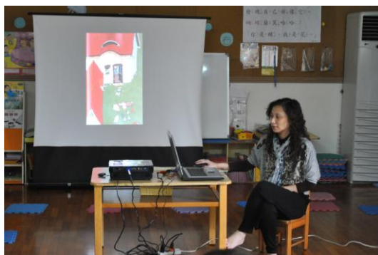
吳老師提供主題教學相關資料，教導園內教師針對主題教學如何讓課程更豐富與完整。