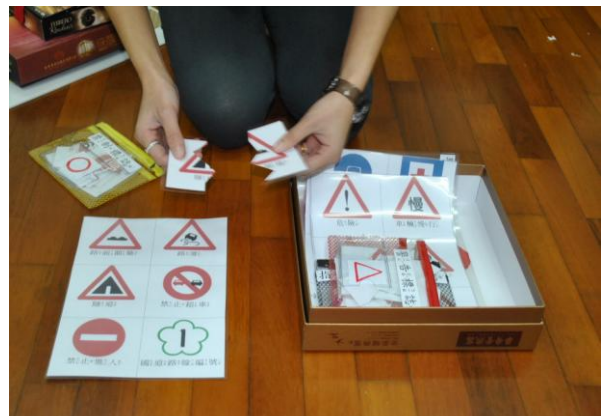
經過吳老師的輔導與建議後，學年教師利用會議時間，進行教具分享與討論，針對主題設計適合孩子的教具，並歸於角落中，讓孩子實際操作與學習。