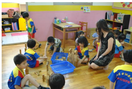
吳老師觀察孩子角落操作，適時介入，從孩子言談互動中，引道孩子