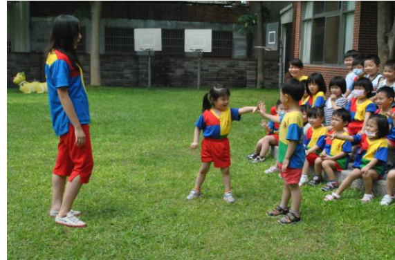
孩子們決定使用猜拳方式，決定筆下的活動誰演誰陪者，誰當小