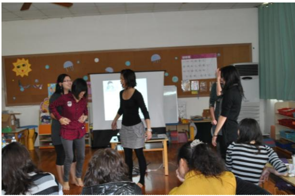
中班學年教師利用遊戲—母子企鵝，進行主題活動延伸教學，藉由演練了解教師個人特質與教學問題。