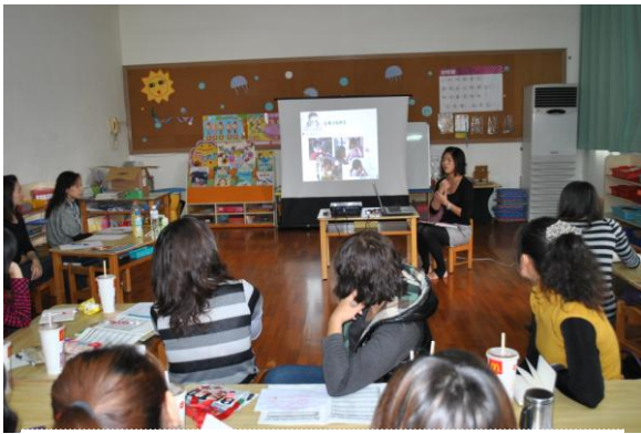
學年教師針對主題活動設計與規劃進行分享，依照活動進度與各班主題延伸方向，進行簡報。