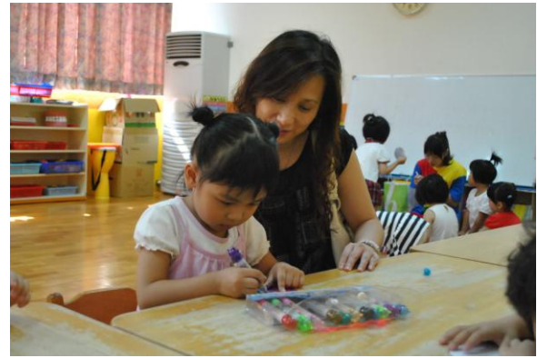
吳老師觀察孩子的創作，適時給予 引道，豐富孩子的想法。