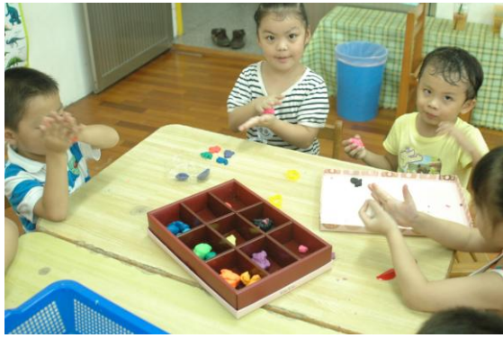
美勞區中的麵粉團，藉由捏、揉、 壓、拍，讓孩子訓練小肌肉，又