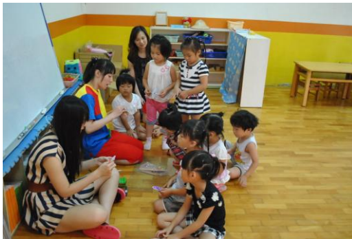
入班觀察教師與孩子的互動情 形，並於活動後分享與討論，以