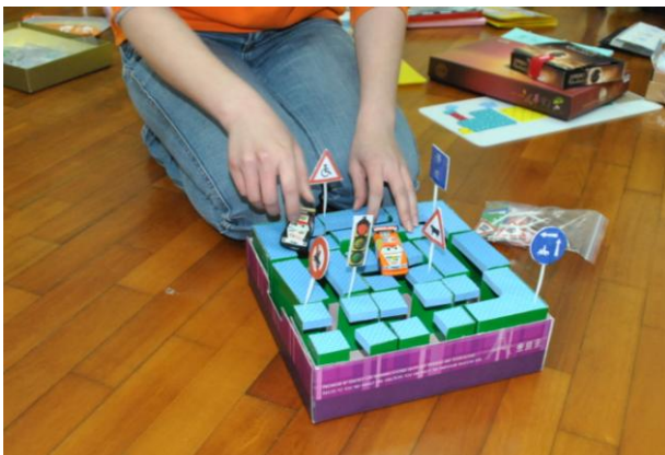
經過吳老師的輔導與建議後，學年教師利用會議時間，進行教具分享與討論，針對主題設計適合孩子的教具，並歸於角落中，讓孩子實際操作與學習。