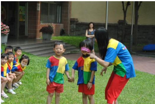
教師請孩子進行信任遊戲，體驗視陪者的立場，更可讓孩子產生同理