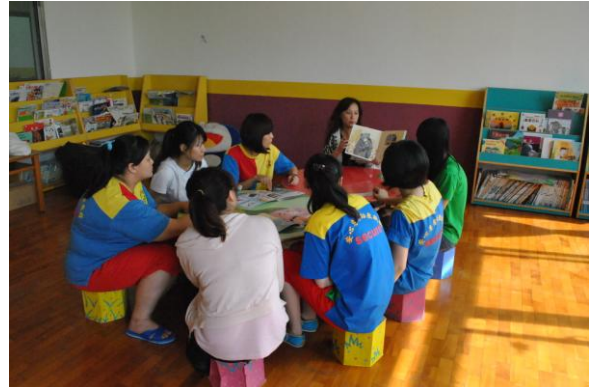
吳老師希望老師們多利用繪本分