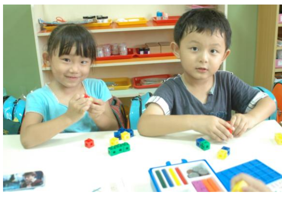
孩子們進行益智區數塊操作，發 現相像的數字。