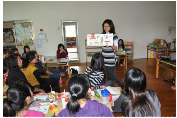
大班學年教師利用故事繪本，進行主題活動教學演練，藉此了解教師個人特質與教學問題。