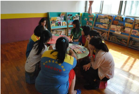
吳老師針對一年的輔導給予分