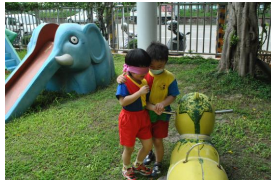
我會照顧你的，你別怕喔！唉呀！他培到毛毛虫了，我們怕怕