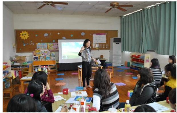
吳老師針對教師教學演練提出建議，並討論未來主題可延伸的方式與豐富性。