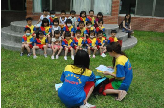
吳老師參與班級活動，觀察教師與孩子們的討論，了解問題成因