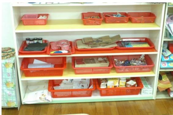
豐富班級角落中教具，與孩子產生更多的故事。