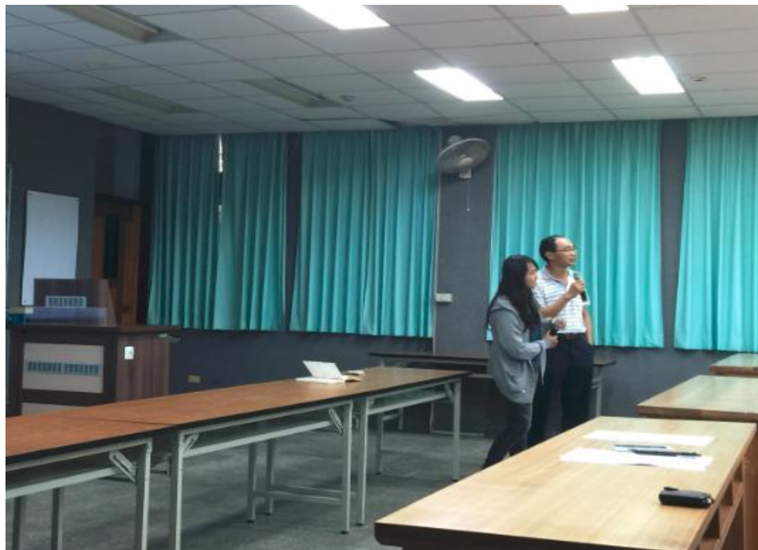
新系學會會長政見發表