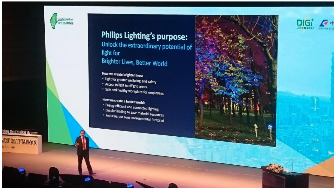
圖二、飛利浦代表談論燈泡結合 IOT