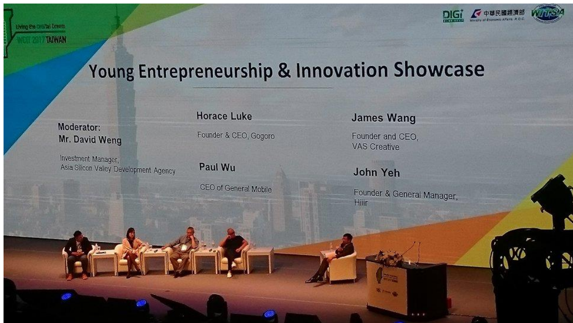
圖三、年輕企業家分享創新與創業