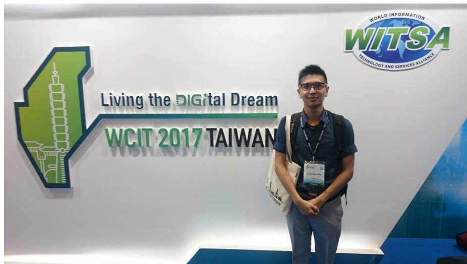
圖一、參加 WCIT 2017 會議