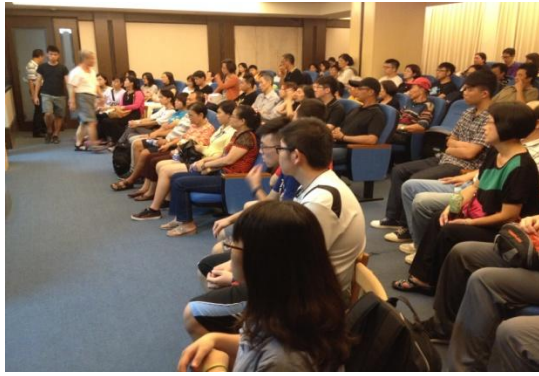
照片說明：現場參與熱烈