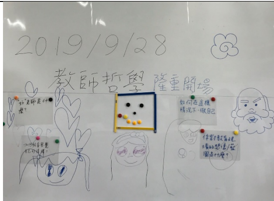
第二階段-提出問題