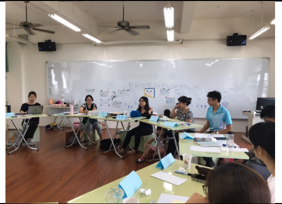
進行分享、討論與回饋