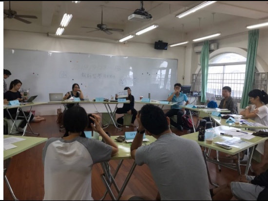
圍圈製造安全環境