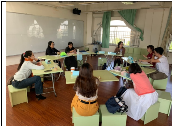
進行分享、討論與回饋