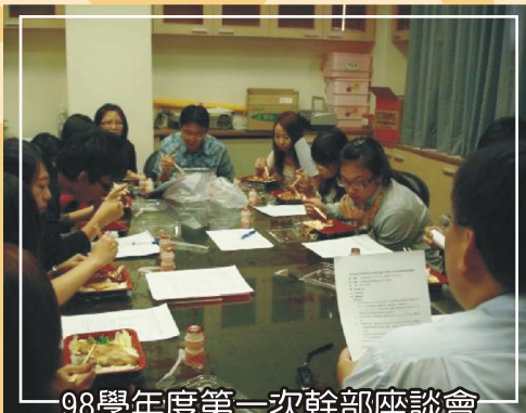
98學年度第一次幹部座談會