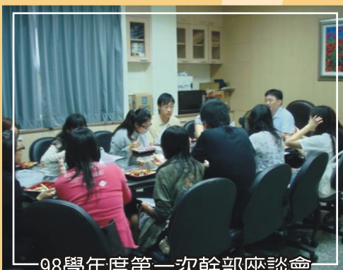
98學年度第一次幹部座談會