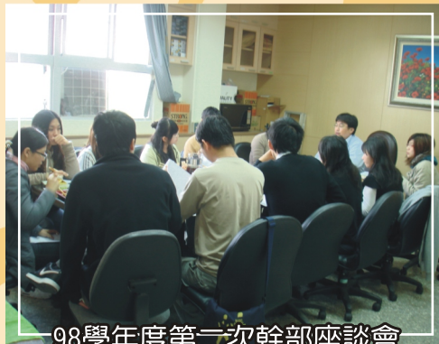
98學年度第二次幹部座談會