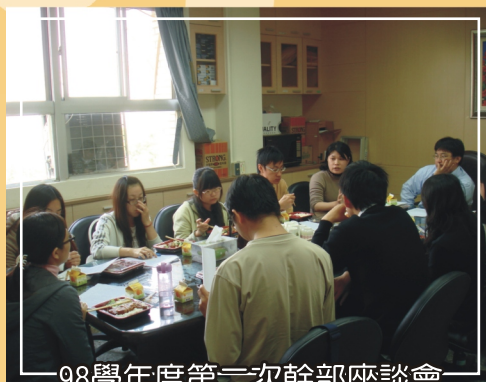
98學年度第二次幹部座談會