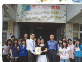
幼兒教育學系99學年度大四集中實習 嘉義市嘉大附幼