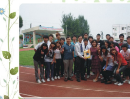
體育學系99學年度大四集中實習 嘉義縣雙埔國民小學