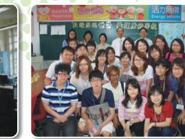
體育學系99學年度大四集中實習 嘉義縣雙埔國民小學