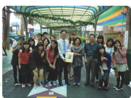
幼兒教育學系99學年度大四集中實習 嘉義縣協同中學附幼