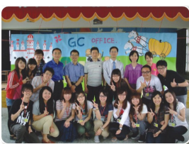
輔導與諮商學系99學年度大四集中實習 嘉義縣東榮國小