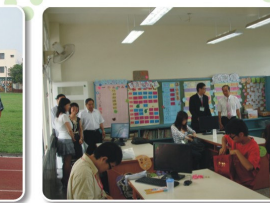
體育學系99學年度大四集中實習 嘉義縣雙埔國民小學