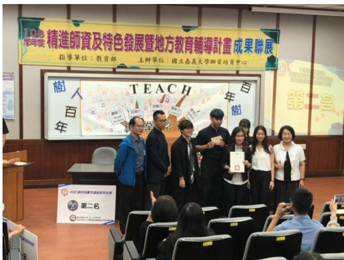
第二名教案設計得獎團體