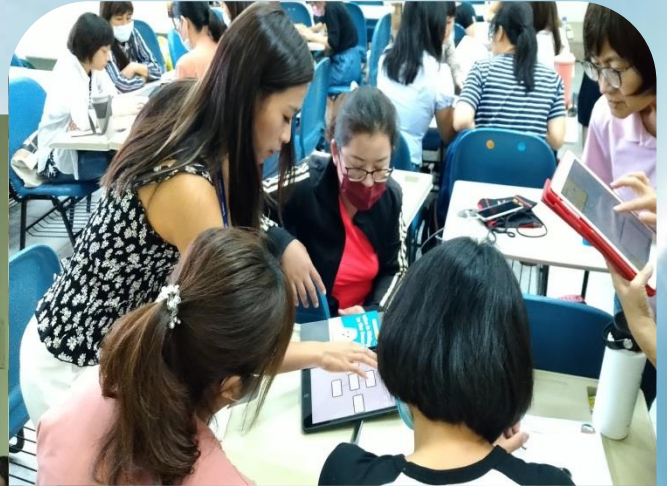
國小英閱講師帶領學員進行評量