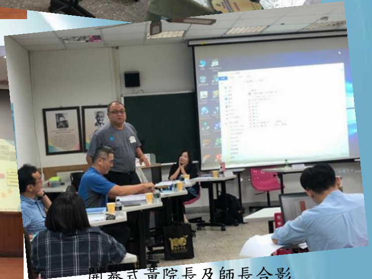
開幕式黃院長及師長合影