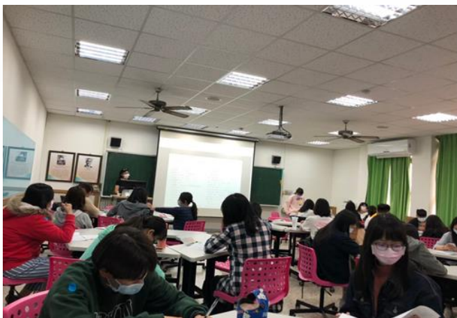
說明：學生練習及討論