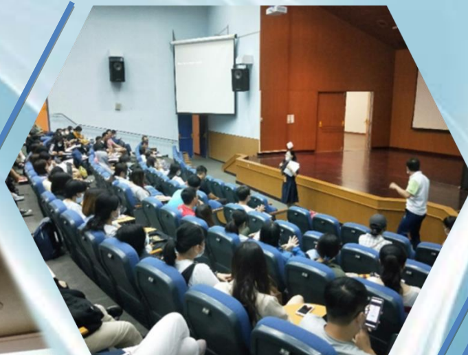
說明：申請教育實習說明會暨 遴選機構說明會談會