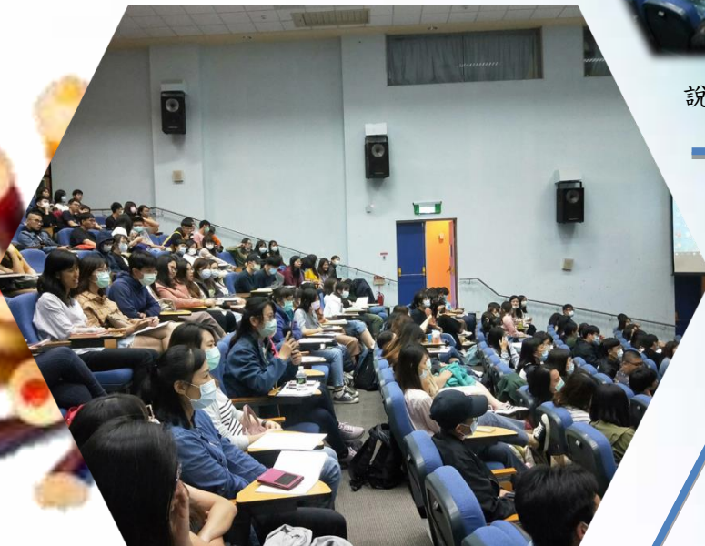
說明：實習生參與狀況