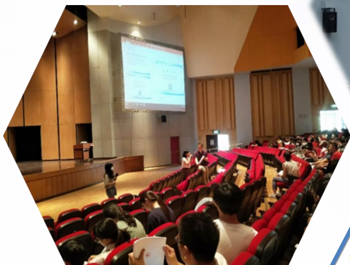
說明：1090925 第一次返校座談會