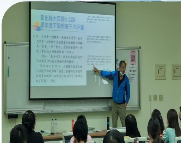
國小數學講師帶領學員進行評量