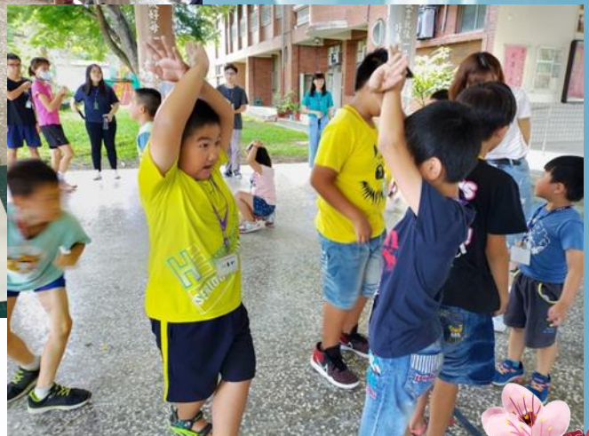
動腦體操大家動起來