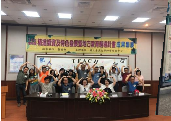
開幕式黃院長及師長合影