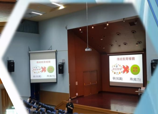
說明：1090925 第一次返校座談會 王政忠老師演講