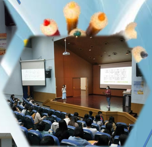
說明：實習平台使用說明