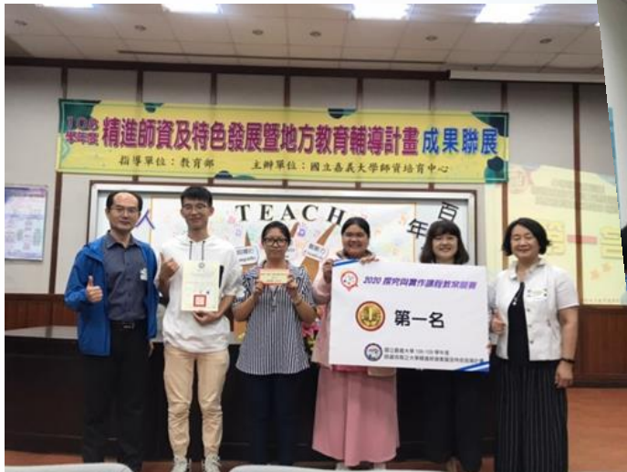
第一名教案設計得獎團體