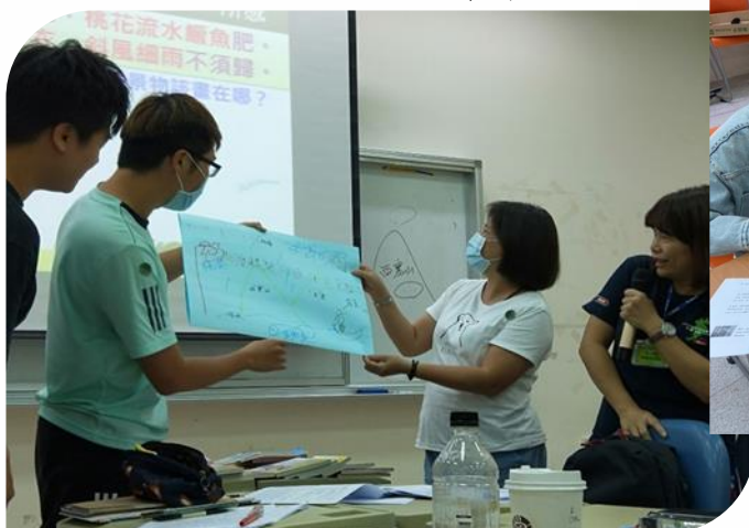
國小國文課堂分組報告