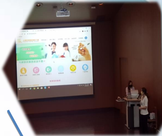
說明：實習平台操作說明