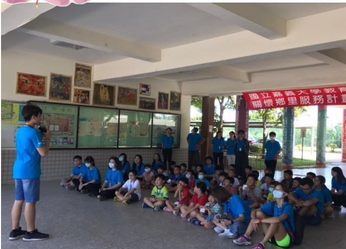
開幕式柳溝國小教師及總召愛的叮嚀