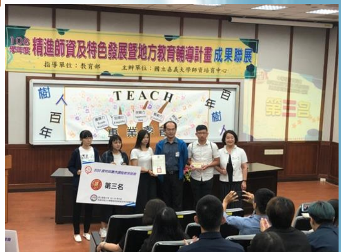
第三名教案設計得獎團體