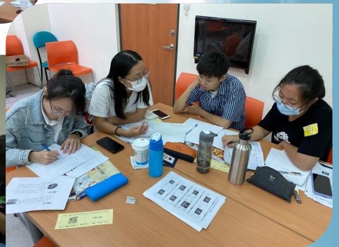
國中國文課堂分組討論