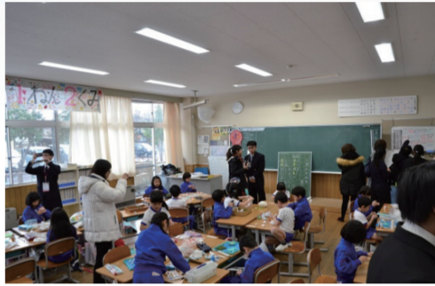
觀課：上越教育大學附設小學創作課程