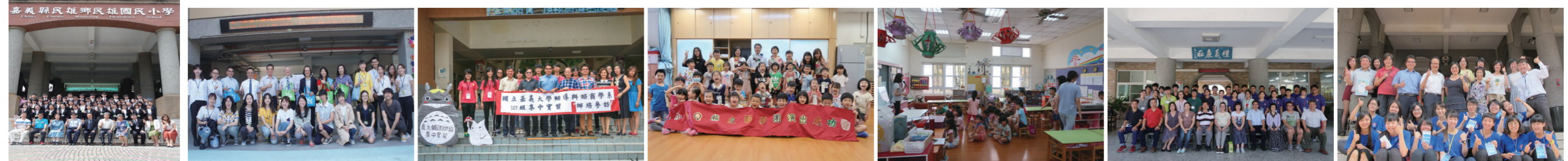
教育學系 106學年度大四集中實習 - 嘉義縣民雄國民小學; 外國語文學系英教組 106學年度大四集中實習 - 嘉義市民族國民小學; 輔導與諮商學系 106學年度大四集中實習 - 嘉義縣福樂國民小學; 幼兒教育學系 106學年度大四集中實習 - 嘉義市垂楊國小附設幼兒園; 幼兒教育學系 106學年度大四集中實習 - 嘉義市幸福幼兒園; 特殊教育學系及體育與健康休閒學系 106學年度大四集中實習 - 嘉義縣興中國民小學; 特殊教育學系 106學年度大四集中實習 - 嘉義市大同國民小學