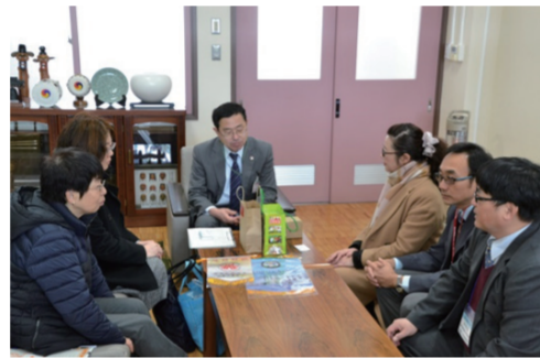
拜會上越教育大學附設中學副校長