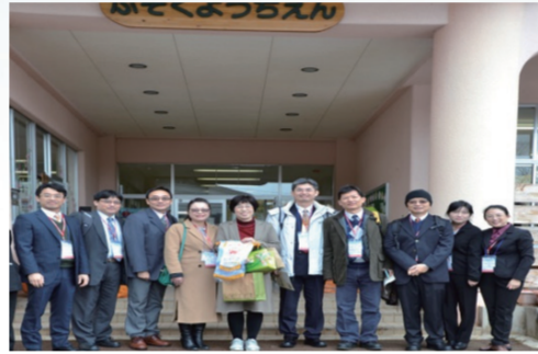
教師於上越教育大學附設幼稚園前合影