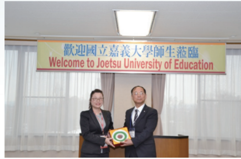
黃院長代表本校致贈上越教育大學紀念品