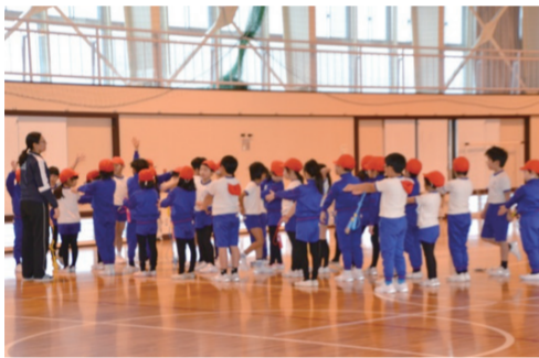
觀課：上越教育大學附設小學體育課