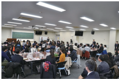
本校學生與上越教育大學學生交流情形