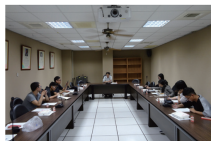
107年3月9日 師生幹部座談會