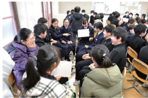
本校學生參與上越教育大學附設中學英語課程的討論