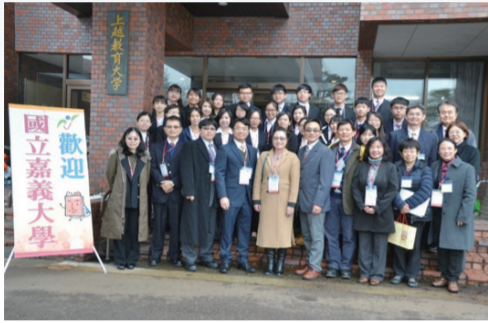
全體團員於上越教育大學前合影