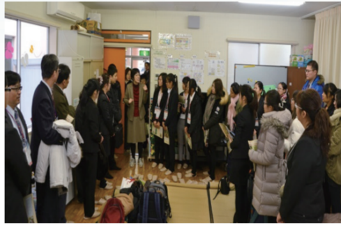
聽取上越教育大學附設幼稚園園長解說