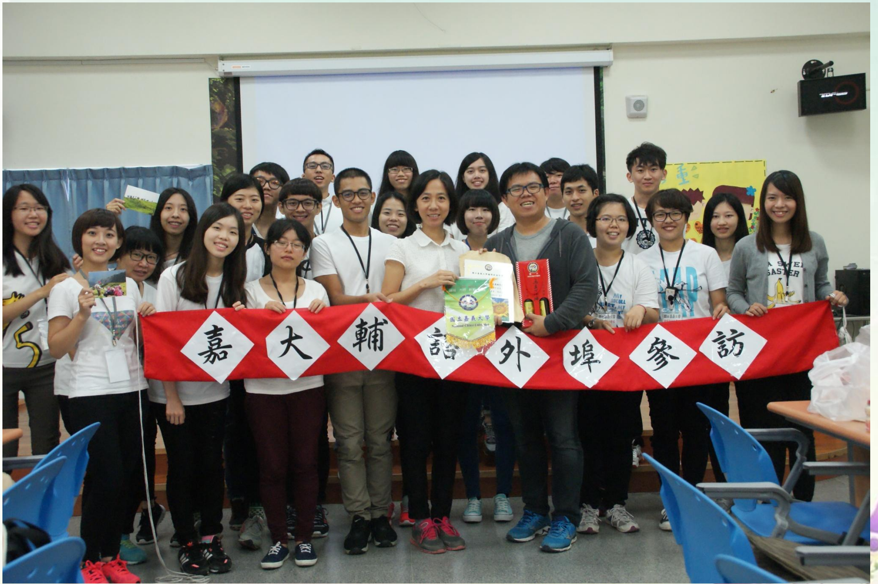
與主任以及老師合影