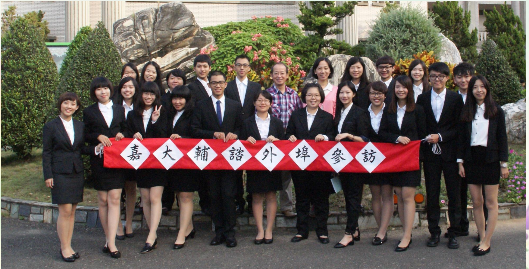
出發前與系主任及帶隊老師的合照