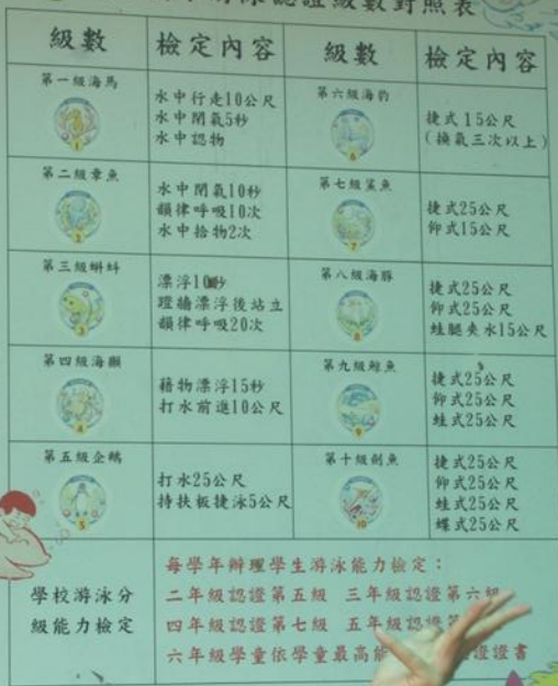
頭家國小游泳認證級數對照表

每學年辦理學生游泳能力檢定： 二年級認證第五級 三年級認證第六級 四年級認證第七級 五年級認證第八級 六年級學童依學童最高級數認證證書