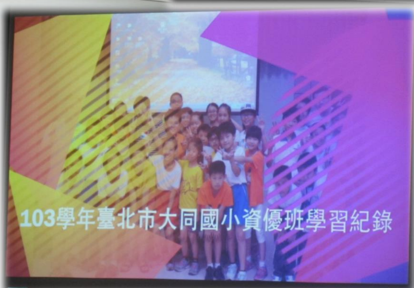
103學年臺北市大同國小資優班學習紀錄