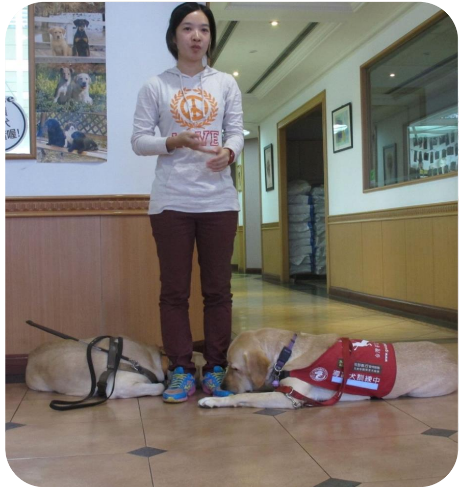
由負責人為我們介紹導盲犬的訓練過程以及成長史