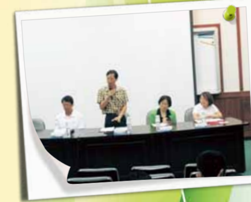
綜合座談 - 主任致詞