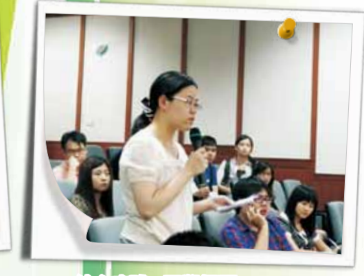
綜合座談 - 同學提問