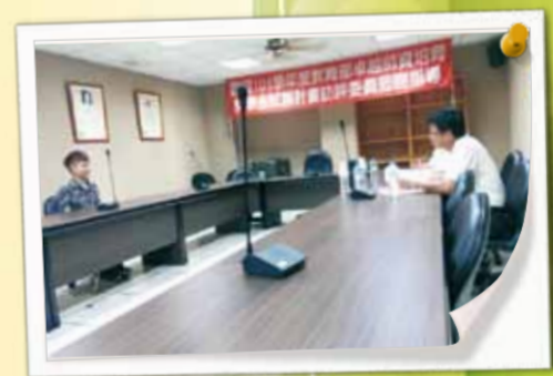
模擬口試 - 豐源