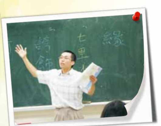
國文科試教 - 警銘