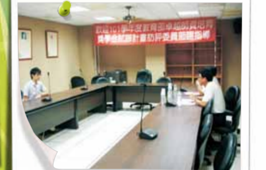
模擬口試 - 邦成