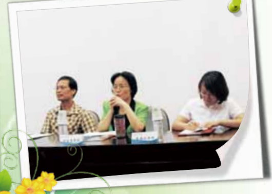
綜合座談 - 英文科校外委員講評