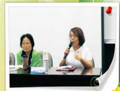
綜合座談 - 國文科校外委員講評