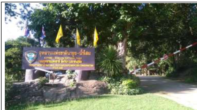
南雲南頌國家公園管理處入口 The entrance of Nayung - Namsom National Park