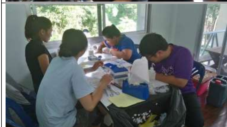
台灣與泰國學生一起進行青蛙解剖、肌肉、血液、骨骼組織樣本採樣。 Taiwanese and Thai students worked on local frogs and collected tissue samples.