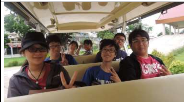
嘉大師生一行參加烏隆塔尼大學校園導覽 UDRU Campus tour with gulf car